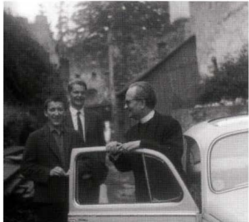
En els seus viatges per Anglaterra

Aprengué l'ofertament d'obres i a lluitar per tenir presència de Déu. Resava el Rosari, i feia una bona