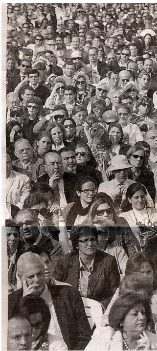
Algunos de los asistentes al acto

Si en el Opus Dei se les llama «tertulias» a estos encuentros, aunque acudan miles de personas, no es extraño que el estrado donde se celebran tenga cierto aire de sala de estar: una trella, una imagen de la Virgen, un centro de flores, una foto de alguien de la casa —en este caso San Josemaría—, y un gran cuadro en el testero principal. El cuadro representaba la vista más tradicional de Córdoba, con la recortada mole de la Catedral y, estratégicamente situado en él, la silueta del Triunfo, coronada por San Rafael. Mayores e invitados se sentaban en los sillones, y los jóvenes directamente sobre el suelo: puro ambiente de familia del que disfrutaron en buena armonía diez mil personas, muchas de ellas venidas de fuera de Córdoba.