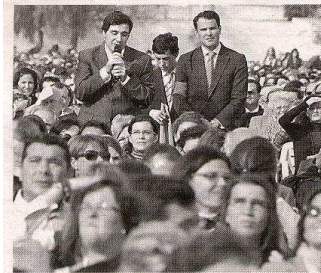
Asistentes toman la palabra durante el encuentro