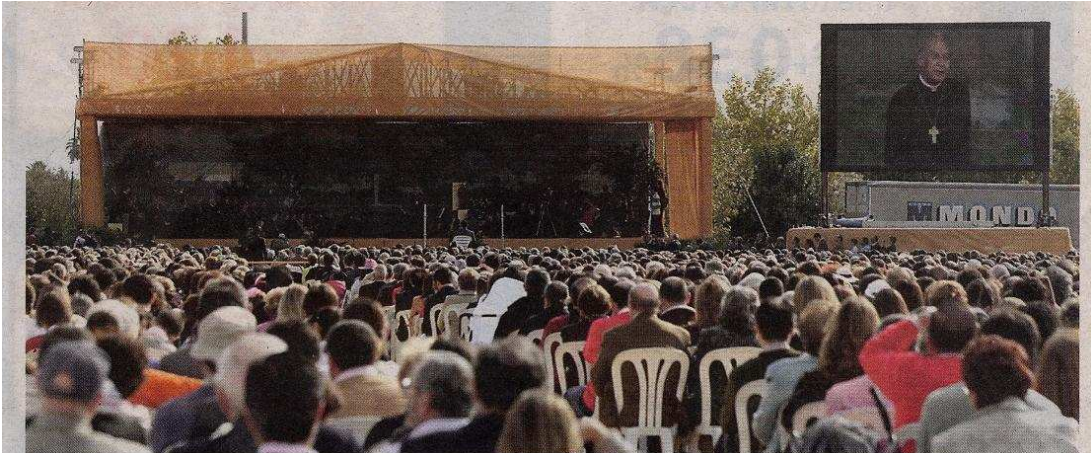
El prelado de la Obra, Javier Echevarría, se dirigió ayer a unas diez mil personas asistentes a un acto celebrado en el colegio cordobés de Fomento