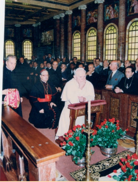
• La oración del Papa Juan Pablo II ante los restos de don Álvaro

Misa: en uno el 20 y en el otro el 21. El 18 celebró en un altar de la Basílica del Santo Sepulcro, y el 19 en la Basílica de la Natividad, en Belén. El día 19, sábado, era mi santo, y don Álvaro me felicitó en cuanto me vio, al bajar a desayunar. Aquel día hubo por la tarde un encuentro en el hotel Paradise, en Belén, con más de cien personas entre las que había cristianos, hebreos, musulmanes... Fue una reunión muy cordial: don Álvaro respondió con enorme cariño y delicadeza a las preguntas que le hicieron. Insistió en la necesidad de que árabes y judíos convivieran pacíficamente. Más tarde, en Jerusalén, visitó al Patriarca latino. Dos días después acudiría también a la Delegación apostólica.