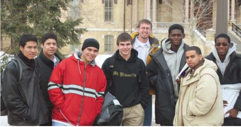
Visita al campus de la Universidad de Notre Dame, Indiana.