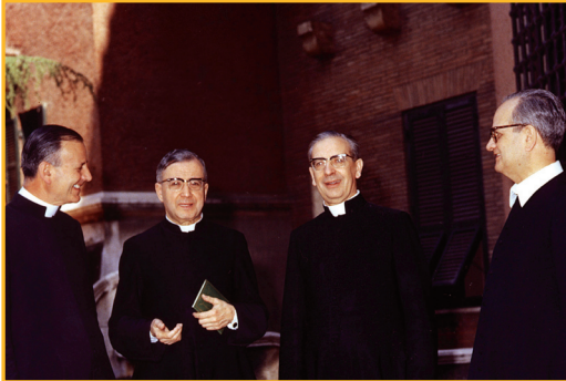
Los tres primeros sacerdotes del Opus Dei, el día del 25 aniversario de su ordenación, con San Josemaría.