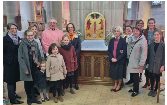
Instalación de un icono de san Josemaría en Rouen (Francia)