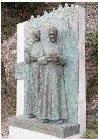
Alt relleu de sant Josepmaria Escrivà i del beat Àlvar del Portillo al santuari de Montserrat (Barcelona)