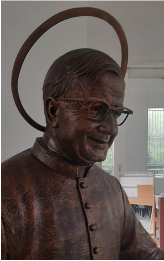
Sant Josepmaria, titular d'una parròquia de Medellín (Colòmbia)