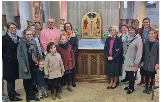
Instal·lació d'una icona de sant Josepmaria a Rouen (França)