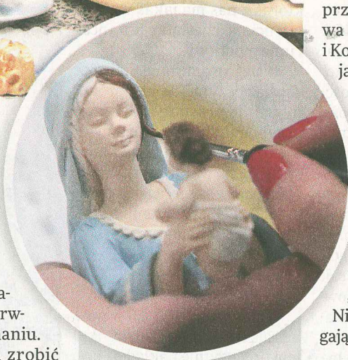
▲ Malują figurki Maryi i płaskorzeźby.