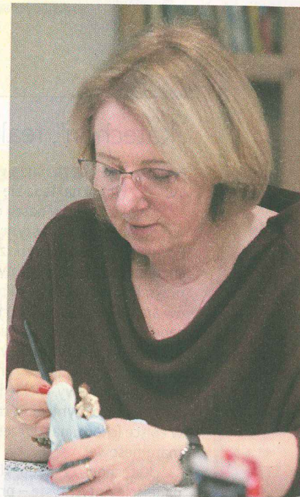
▲ Pani Wiola maluje postać Matki Bożej z Dzieciątkiem.

i „postarza” pracę. A zupełnie na końcu, co może zaskoczyć – posypuje się gotową figurkę... zasypką dla niemowląt. I znów poleruje. Ten zabieg powoduje, że kolory i całość matowieją, subtelnieją, nabierają klasy. – Pracujemy dla Maryi, nie dla zysku. Zyskujemy więcej, niż jesteśmy w stanie w tę pracę