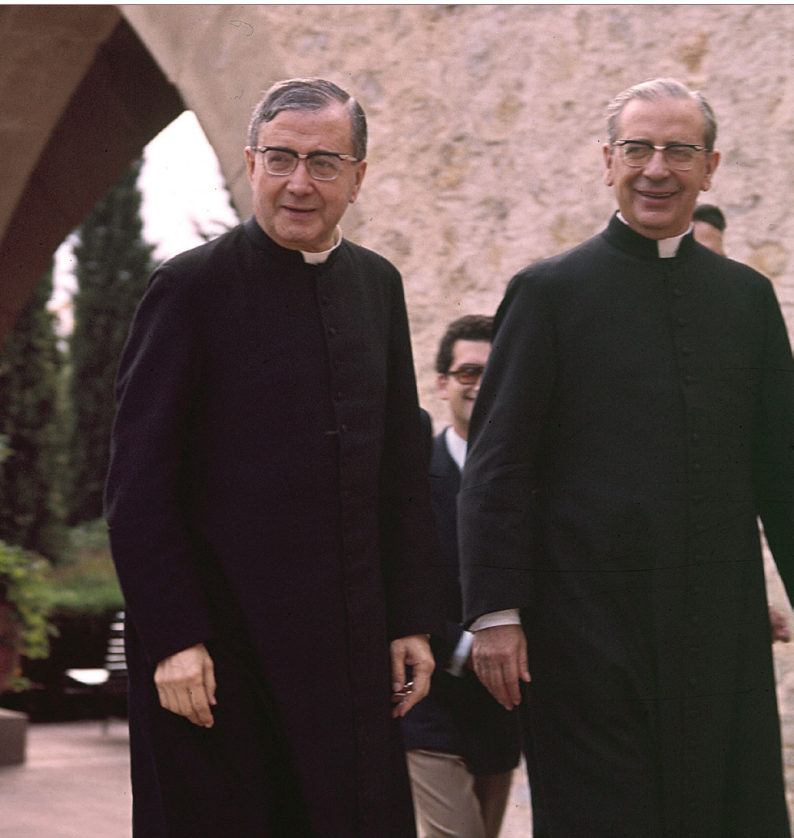
Święty Josemaría Escrivá z błogostawionym Álvaro del Portillo Hiszpania - Castellidaura, 1972