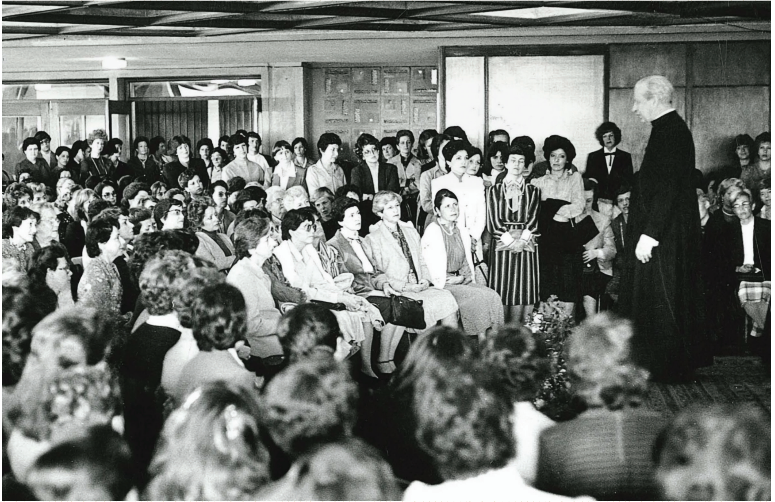
Tertulia en Torreblanca con numerarias auxiliares