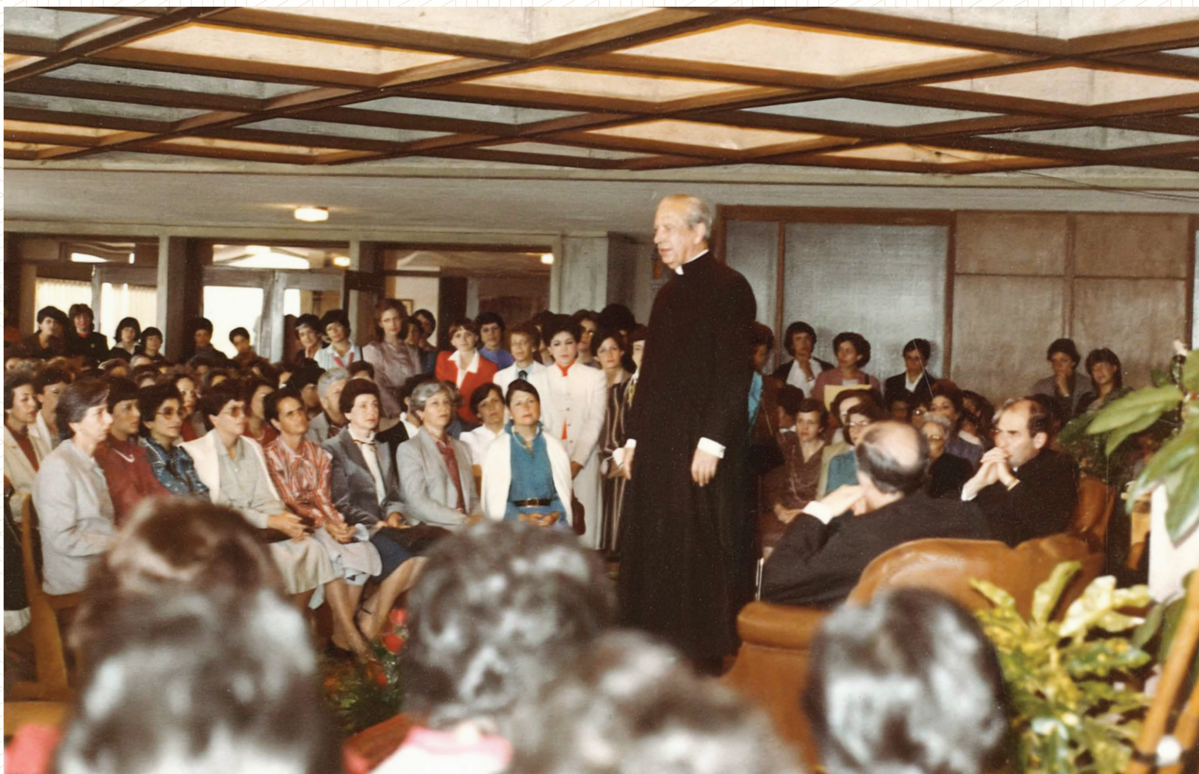
Tertulia en la Biblioteca del Gimnasio de Los Cerros