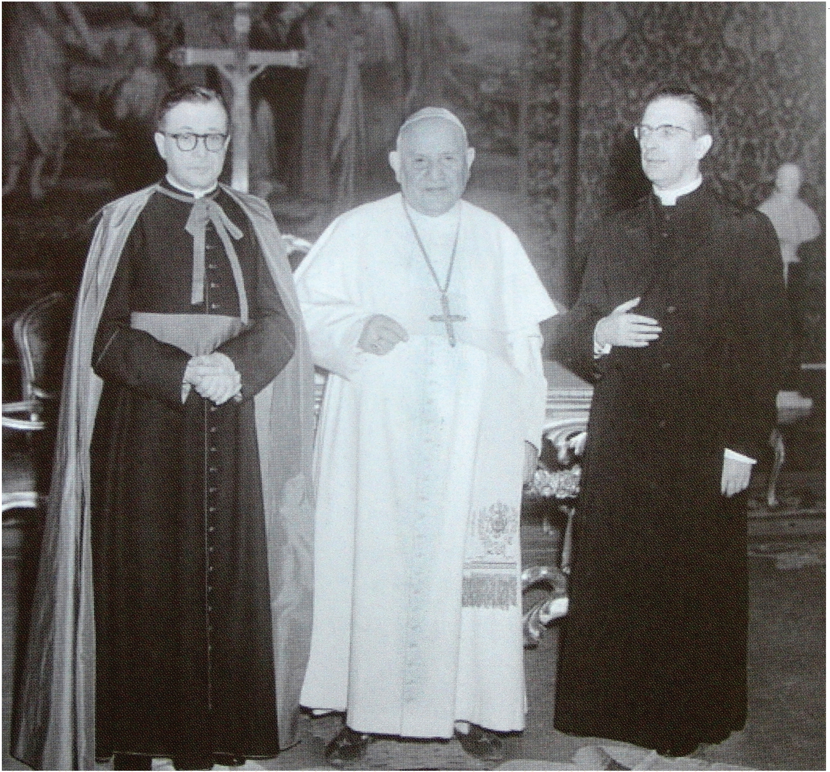
Con el papa Juan XXIII y san Josemaría, en 1960