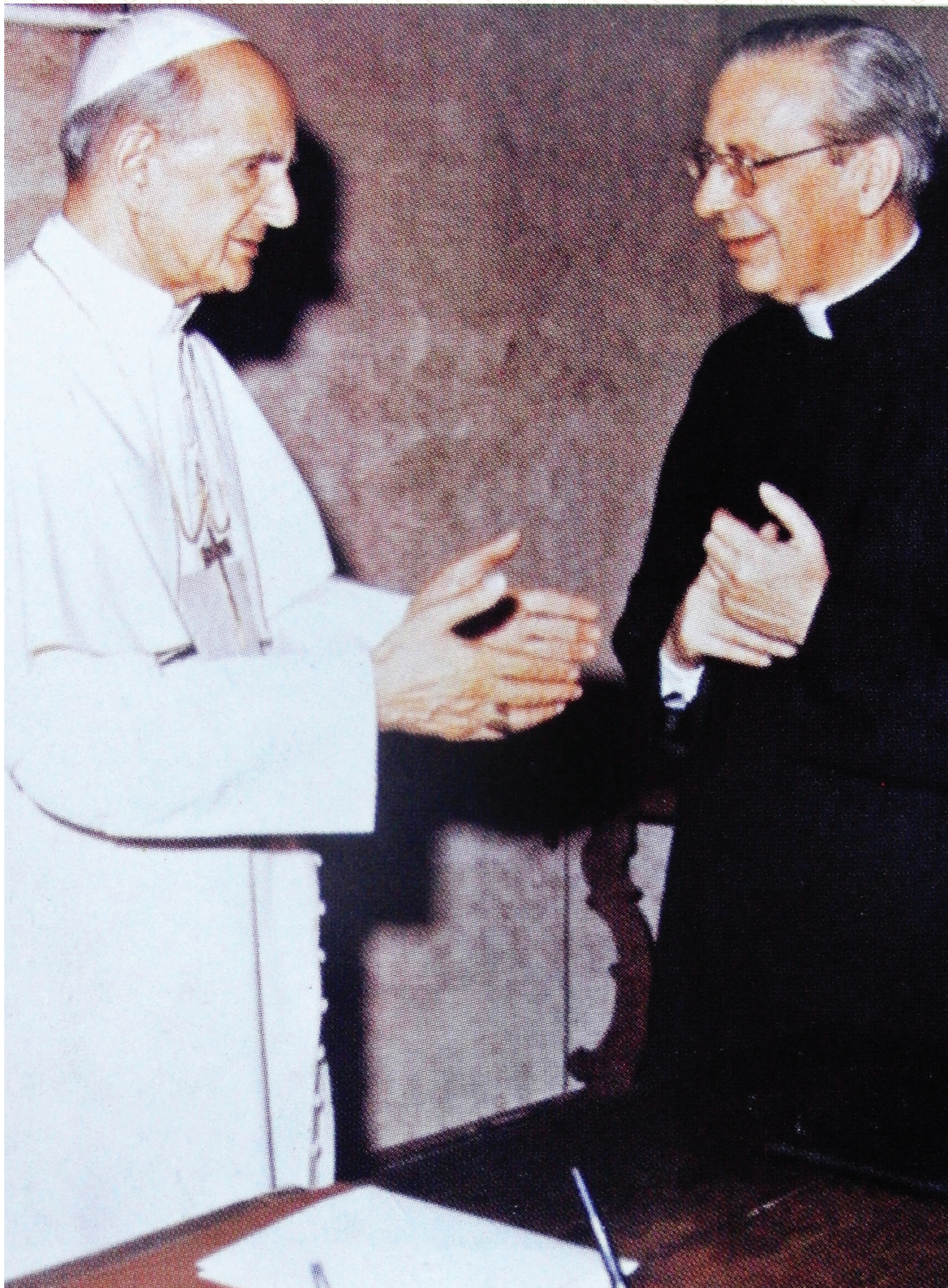
Con el papa Pablo VI