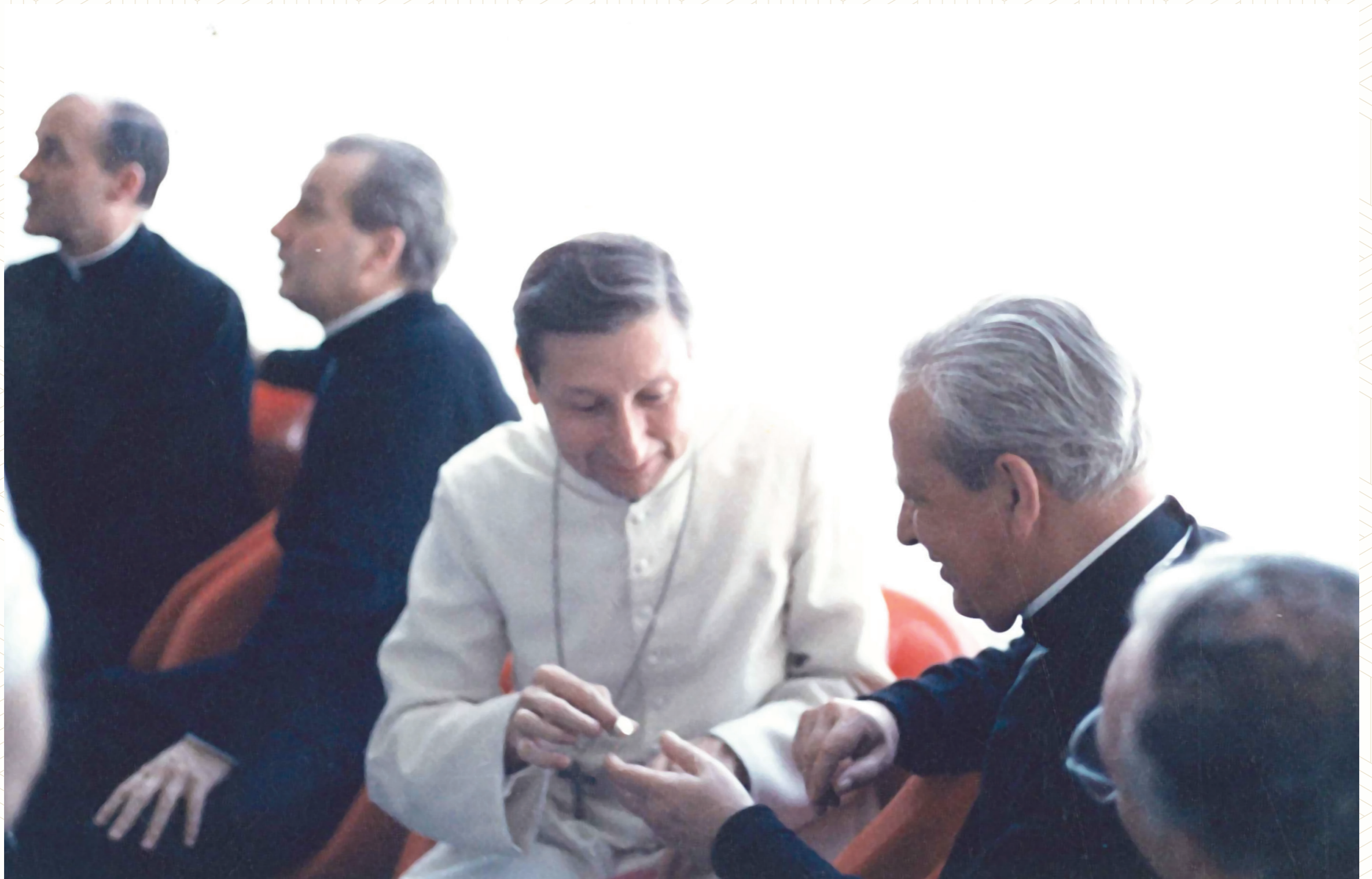
En el aeropuerto de Barranquilla el 2 de junio de 1983, con Mons. Ugo Puccini, obispo emérito de Santa Marta, momentos antes de dejar suelo colombiano.