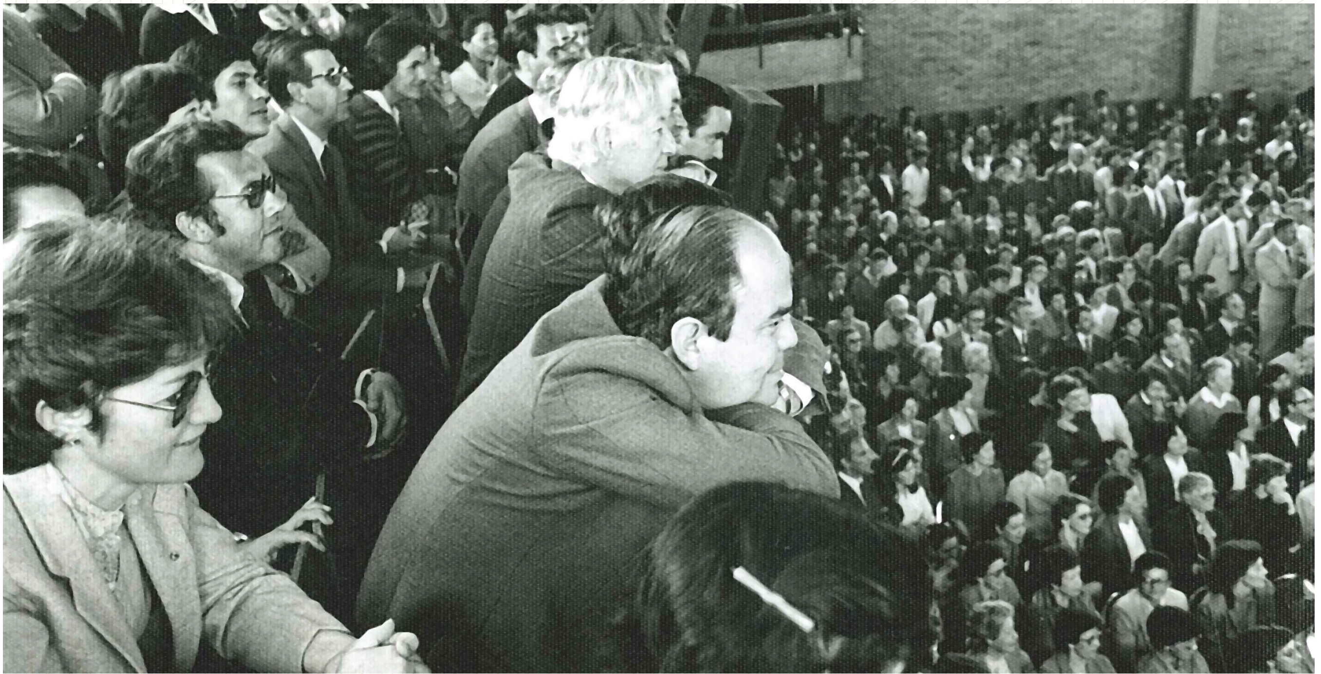
Tertulia con el beato Álvaro del Portillo en el Gimnasio de Los Cerros en Bogotá, 27 de mayo de 1983. Aunque la asistencia siempre fue multitudinaria, nunca se perdió el ambiente de familia.