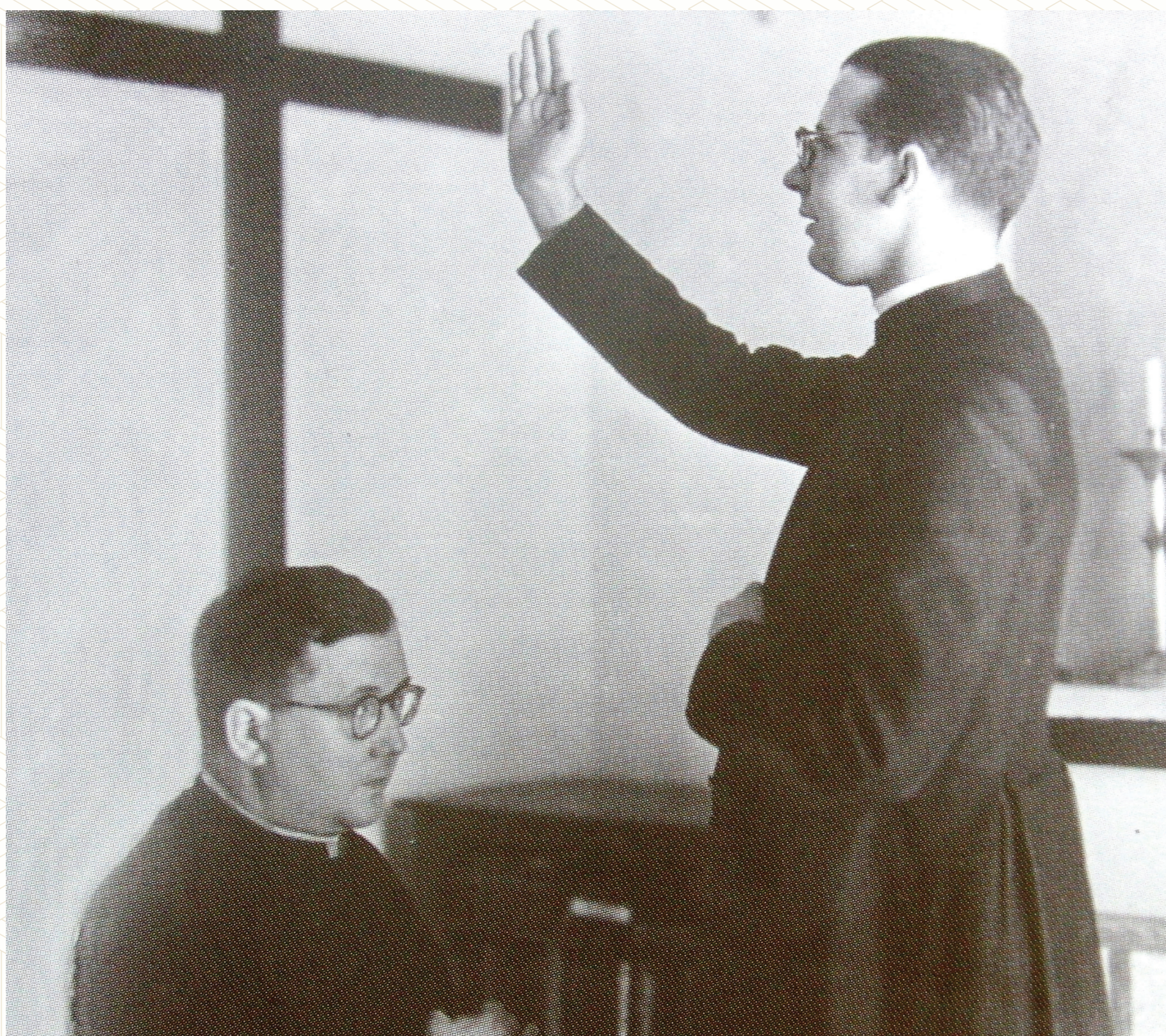
El beato, recién ordenado, bendice a san Josemaría