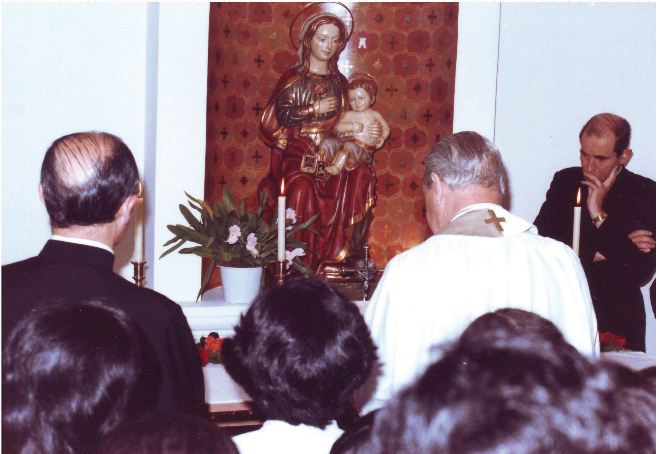
Bendice a la Virgen de la Ermita de Torreblanca