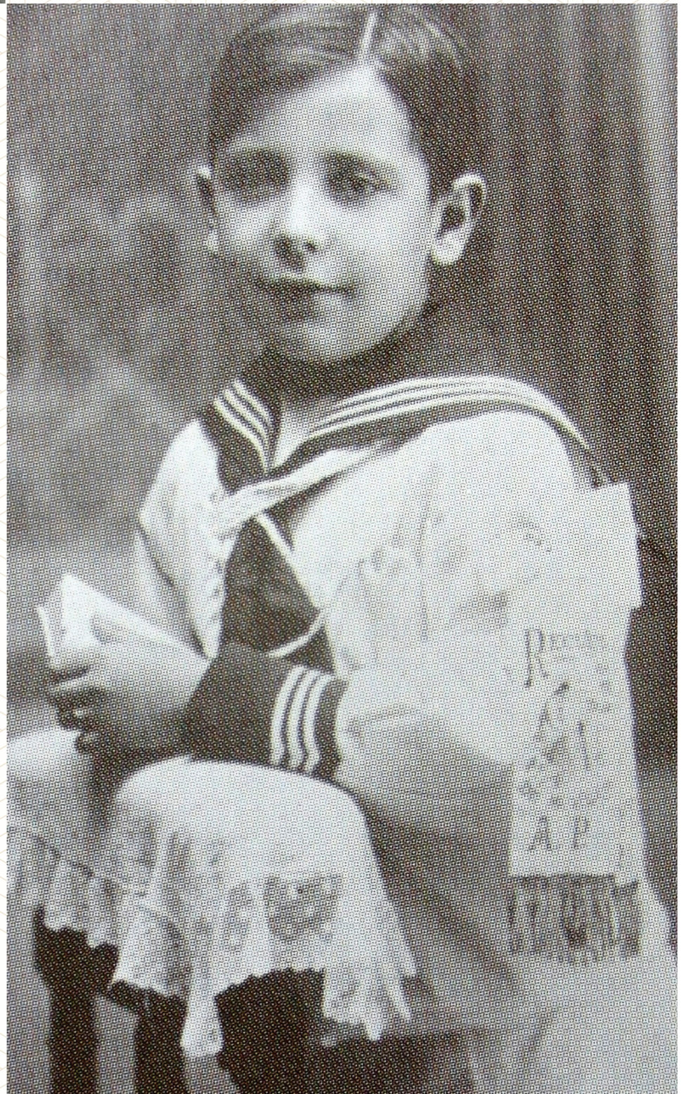
El día de su Primera Comunión