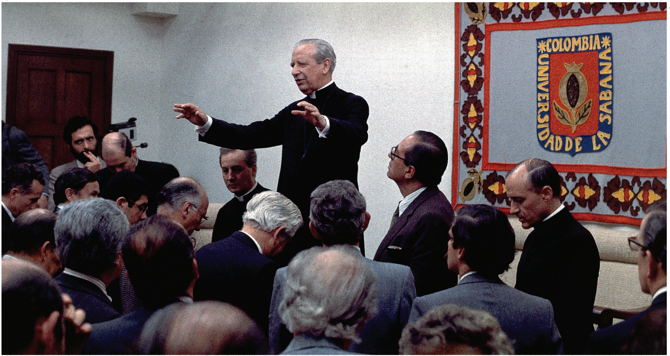
Bendición a directivos y profesores de la Universidad de La Sabana