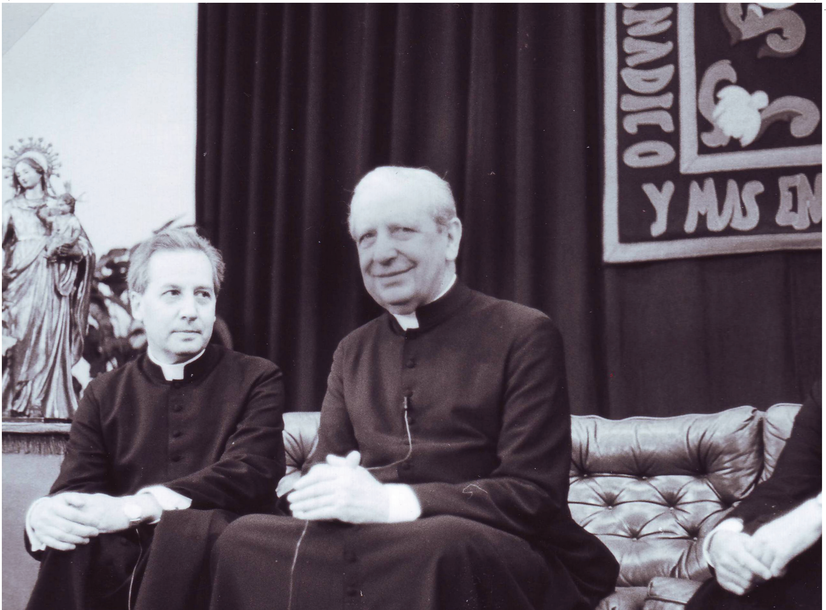
En Bogotá con Monseñor Javier Echevarría