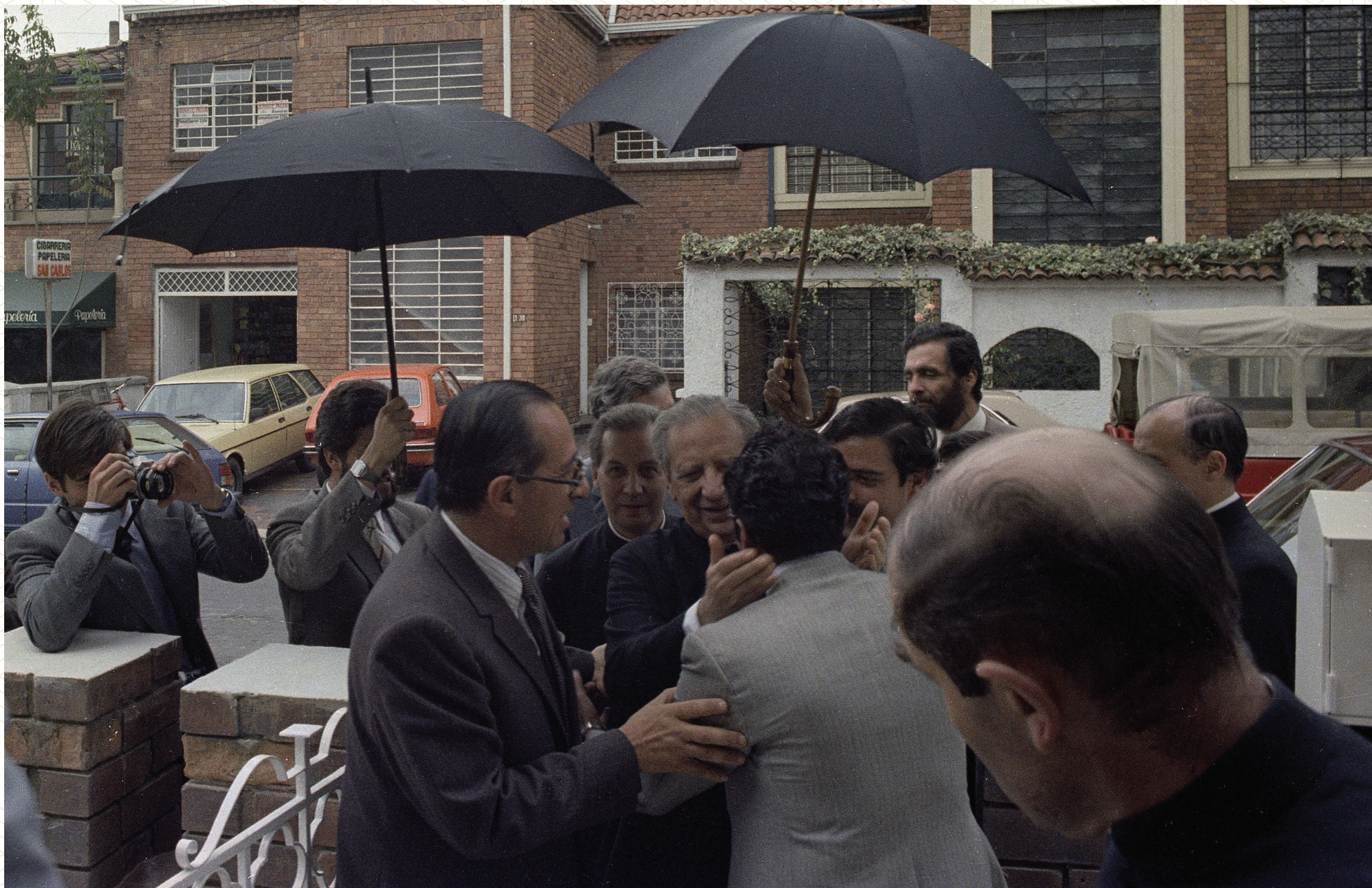
Llegada a la Universidad de La Sabana en su sede de Quinta Camacho