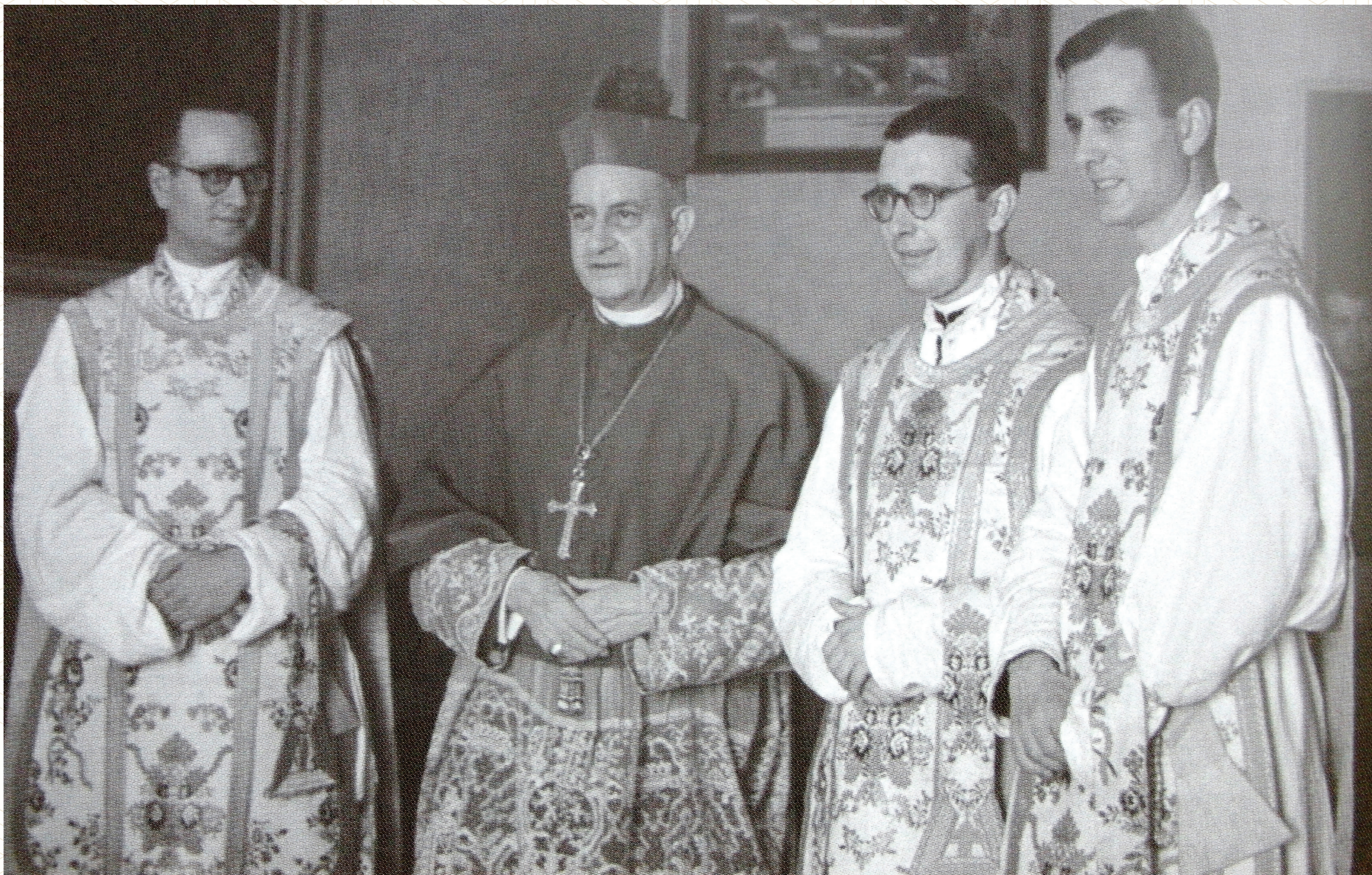
El día de su ordenación sacerdotal, junio de 1944