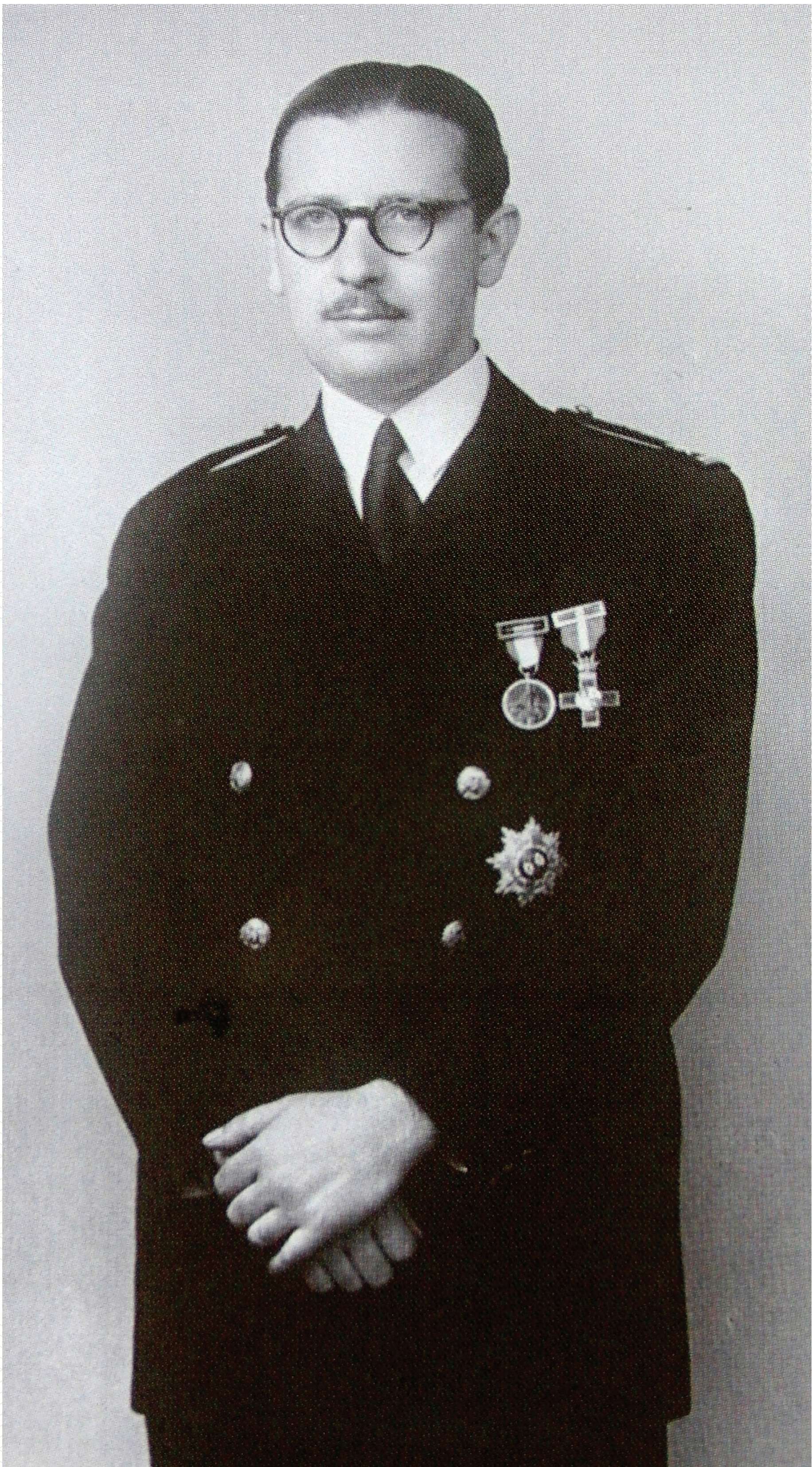
Con el uniforme de Ingeniero de Caminos