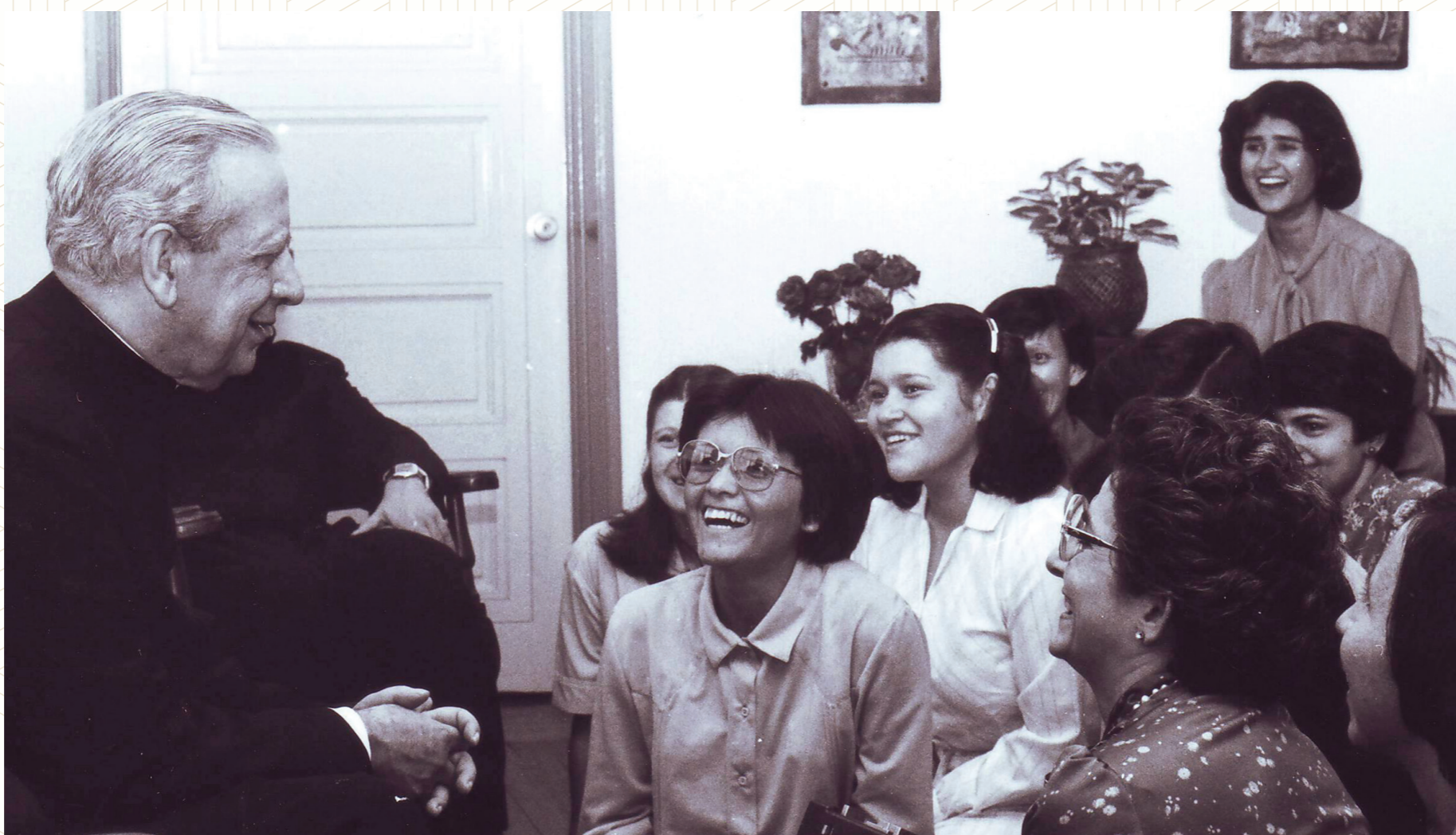
Encuentro con mujeres de la Prelatura