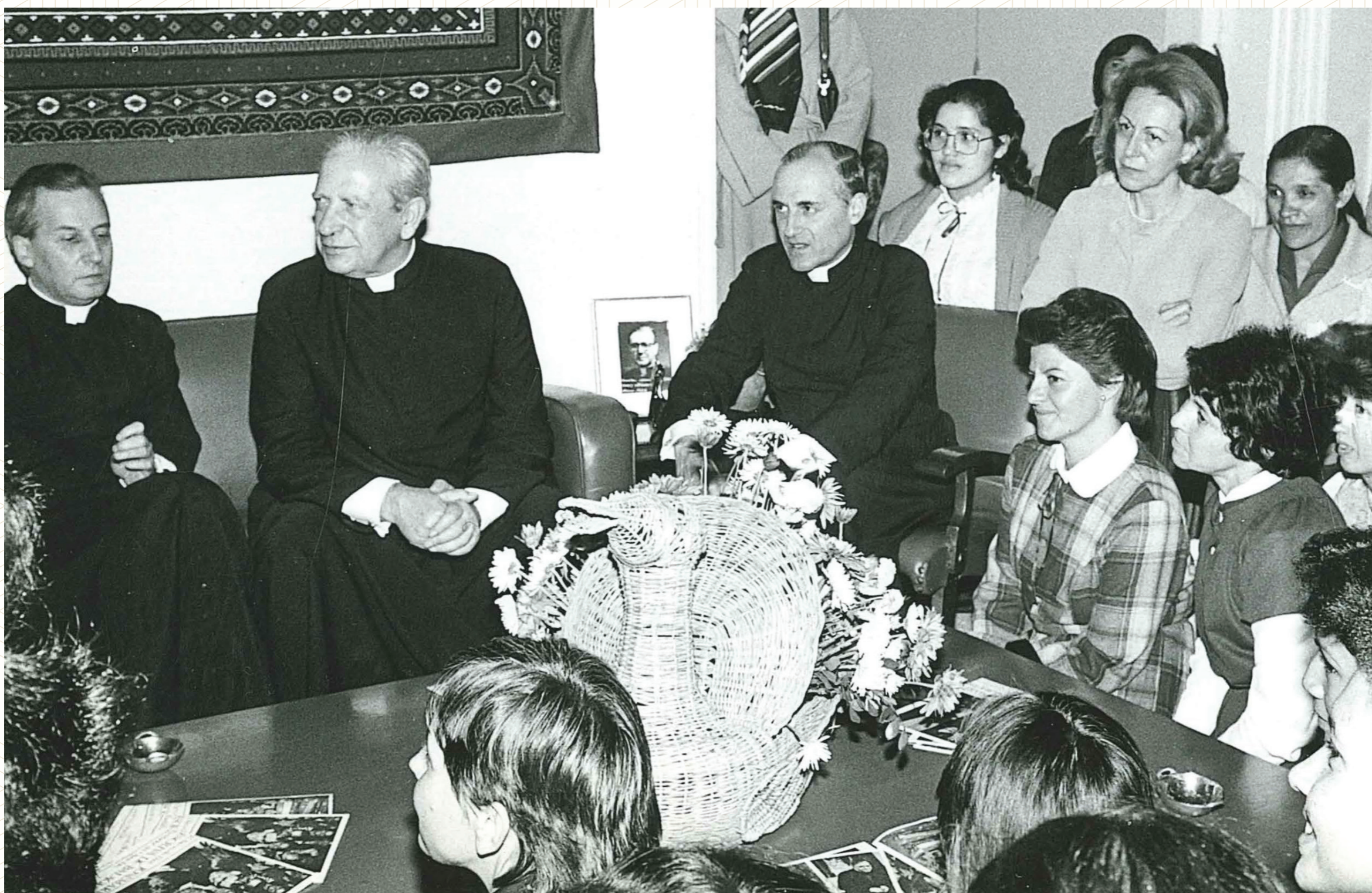
Tertulia en La Casona, administración de Torreblanca