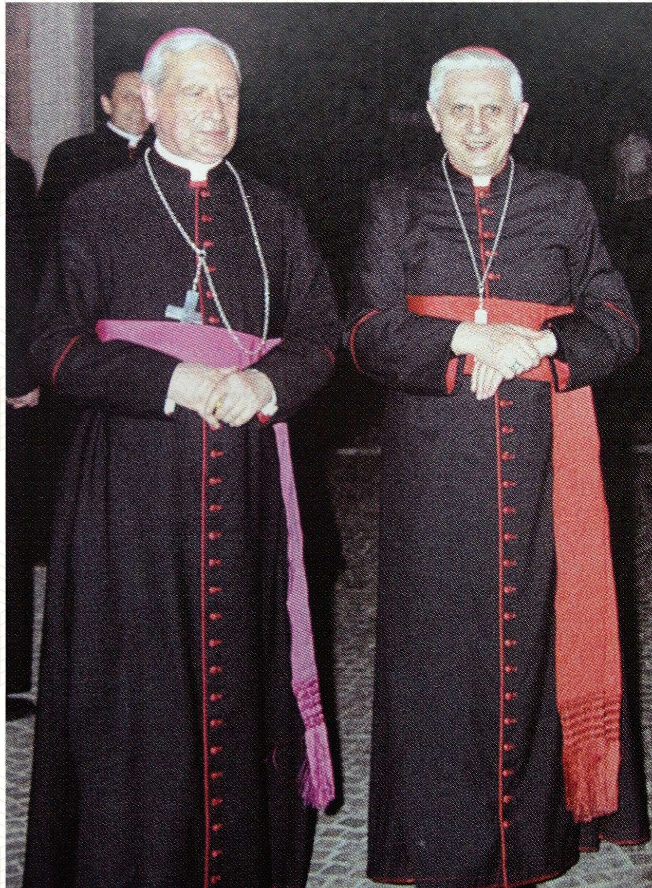
Con el cardenal Ratzinger