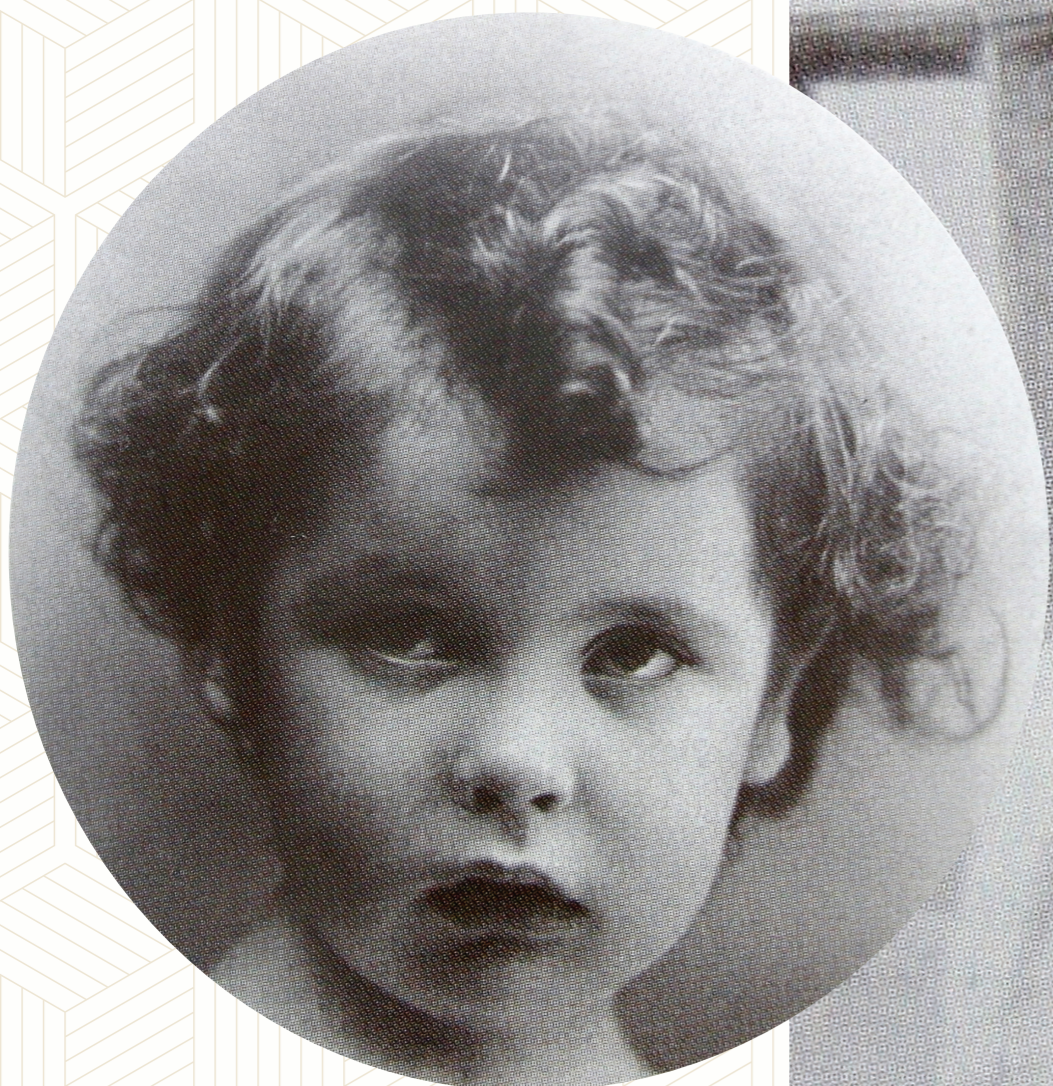
A la edad de dos años