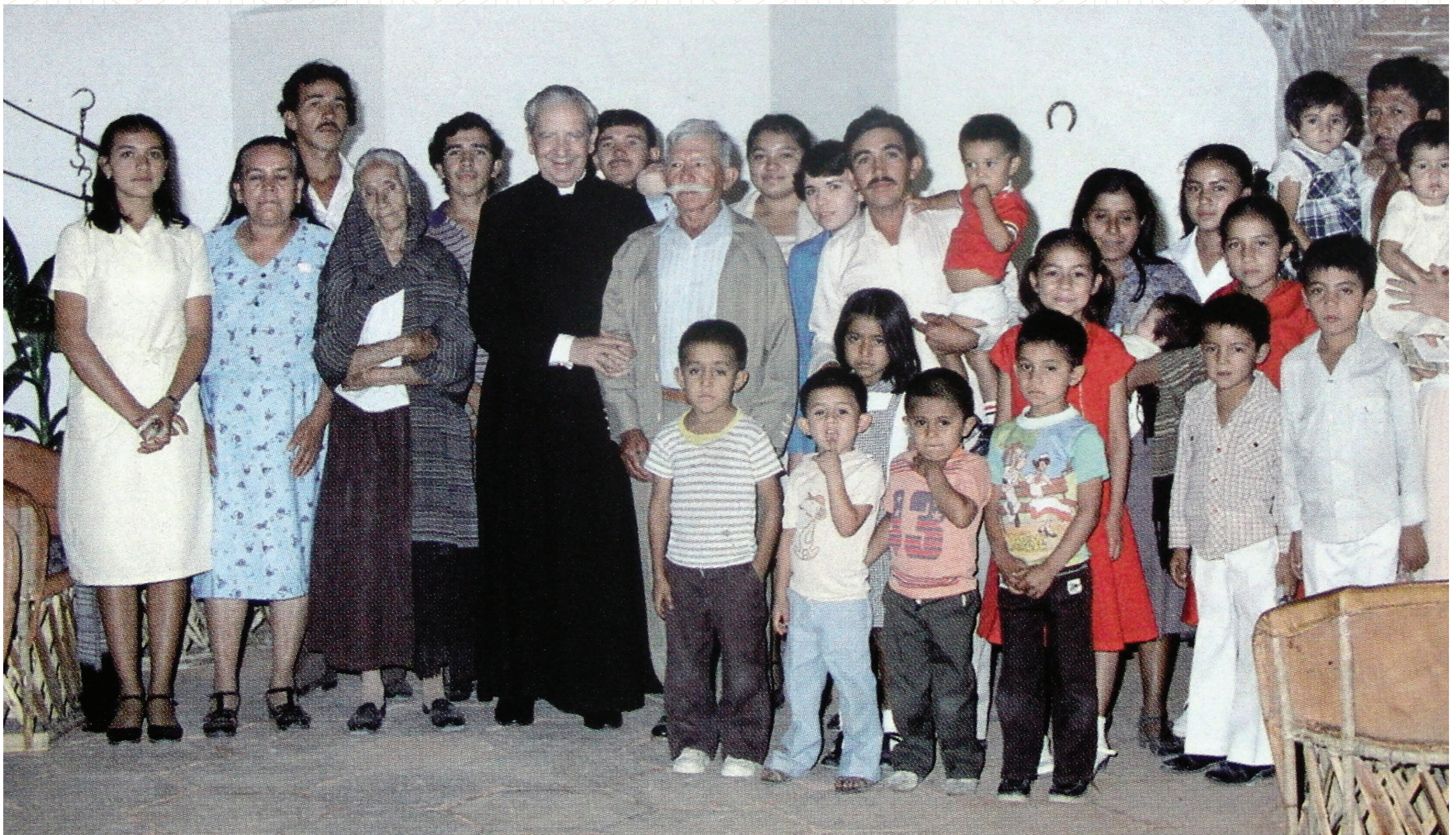
En Montefalco con una familia mexicana