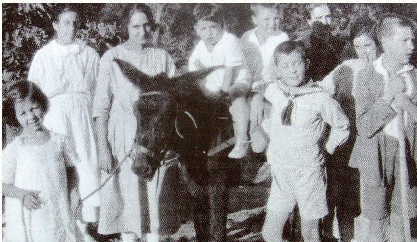
Con amigos de infancia