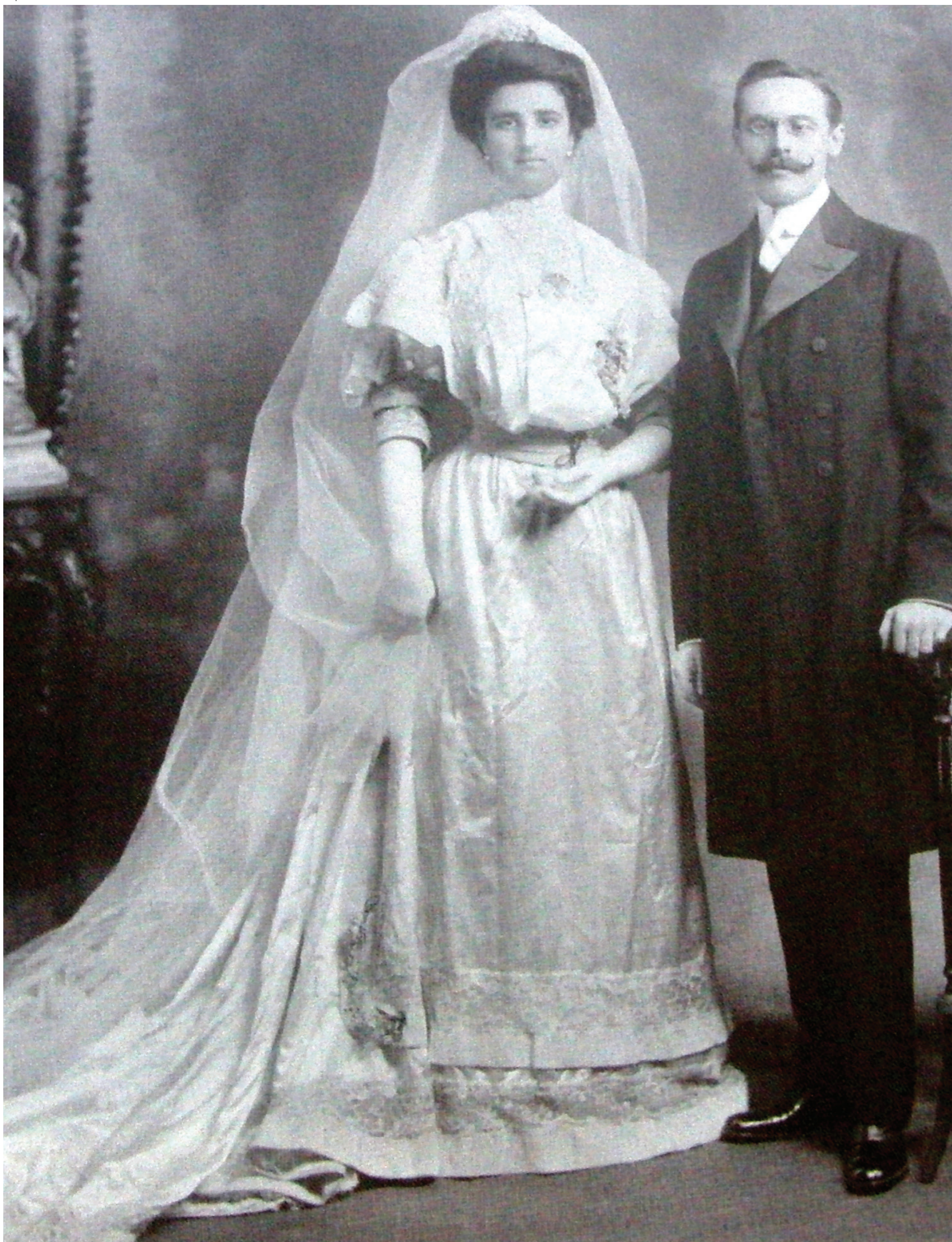
Matrimonio de sus padres