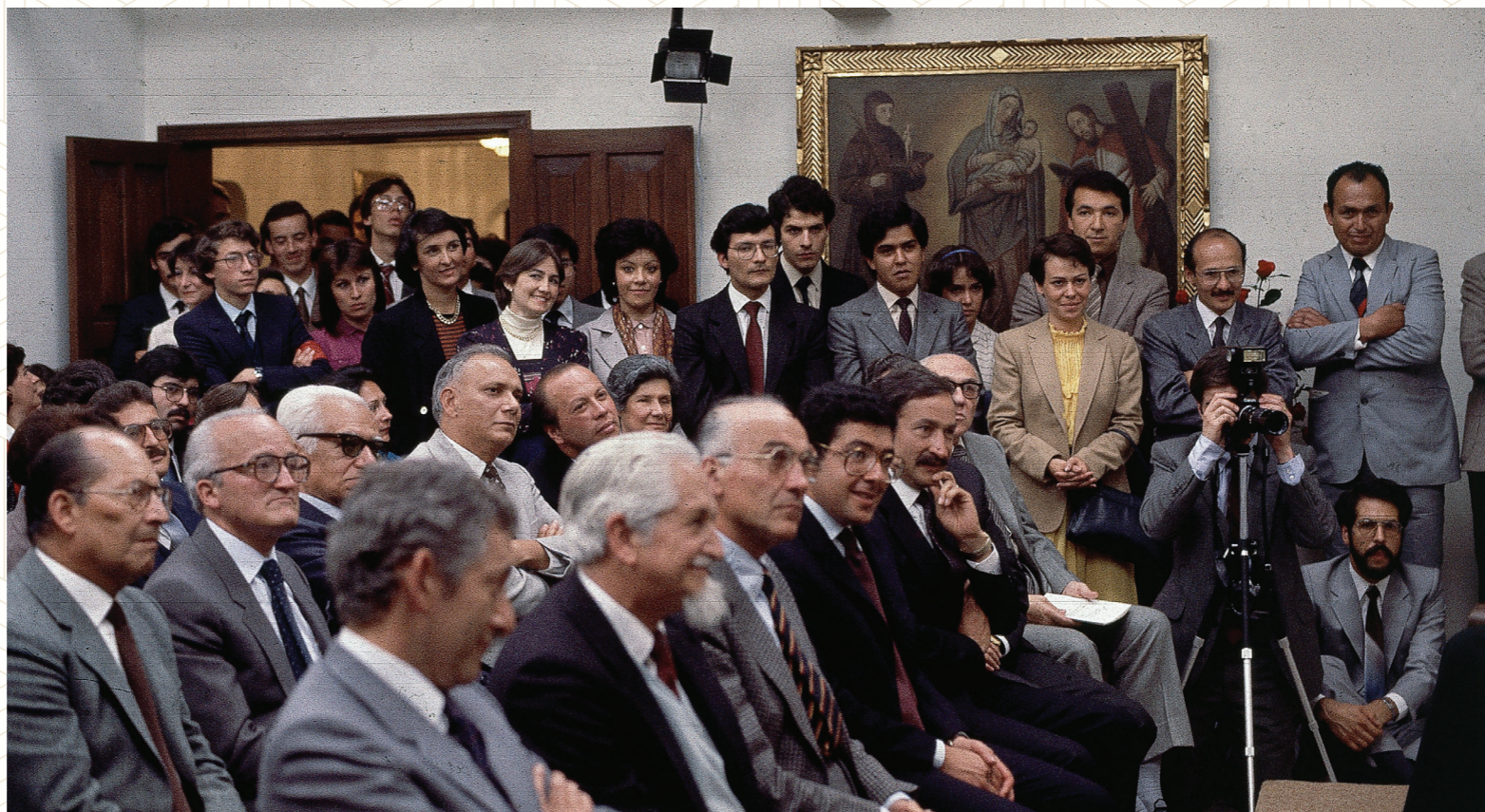
Tertulia en Quinta Camacho