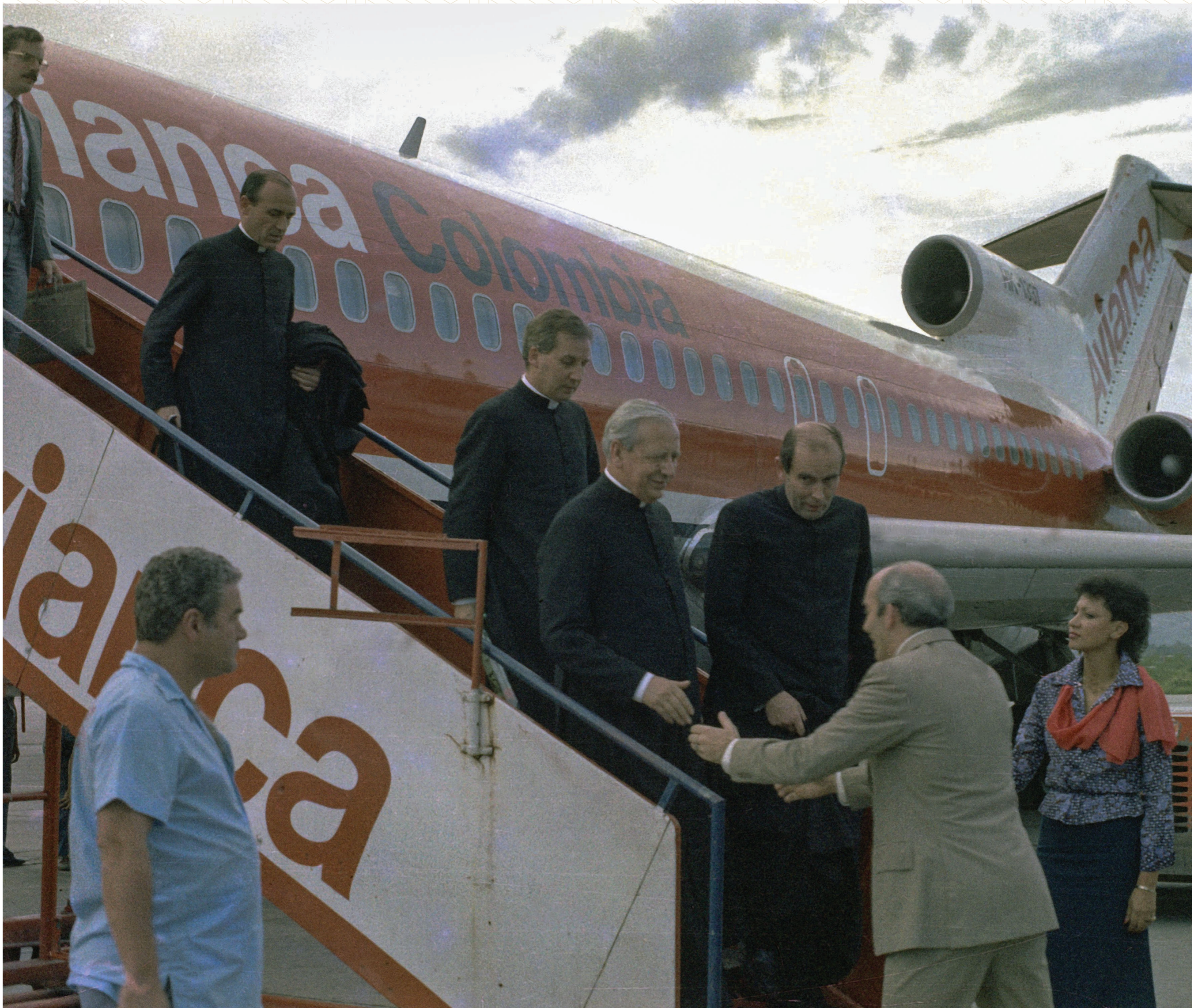
Llegada a Medellín, mayo de 1983