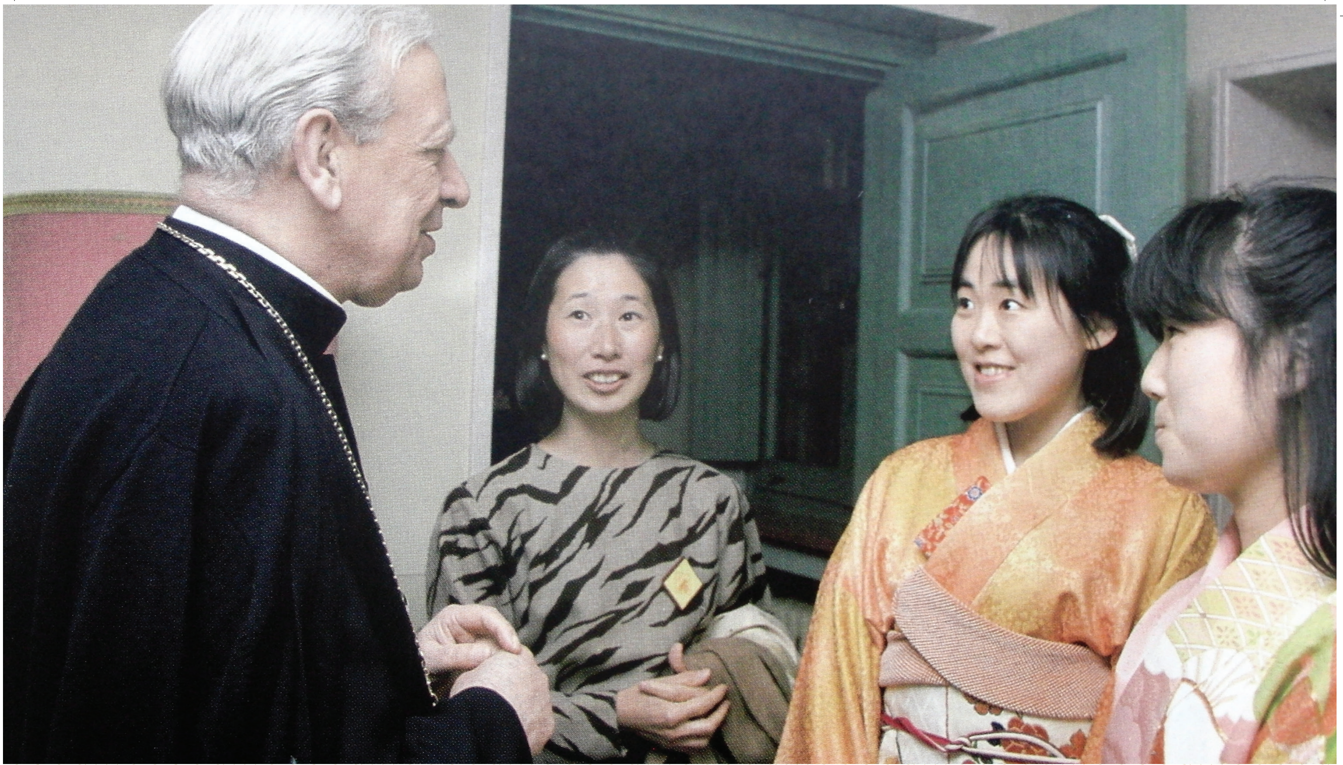
En Japón en 1987