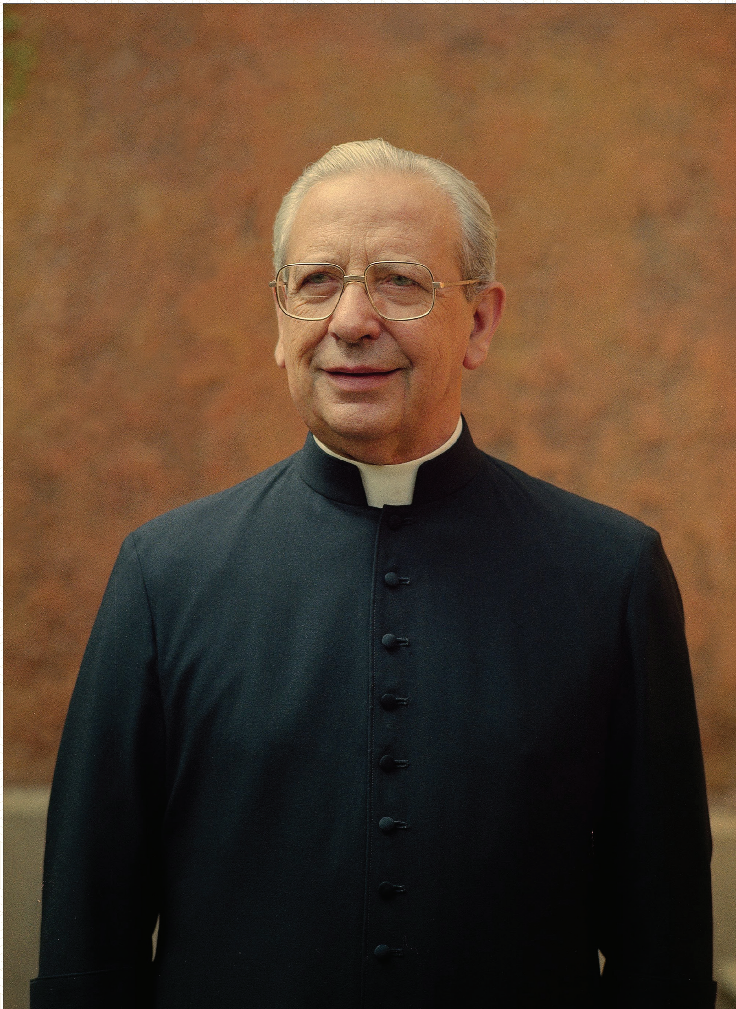
Beato Álvaro del Portillo