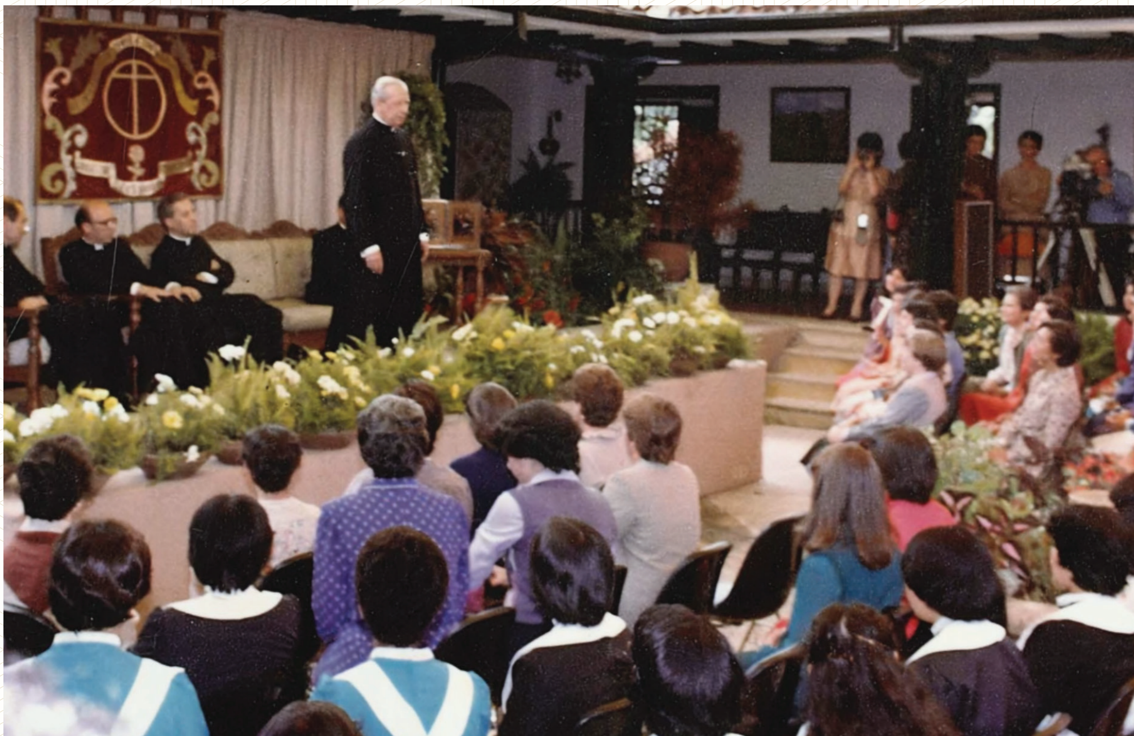
Tertulia en el patio Colonial de Torreblanca