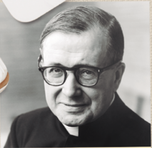
San Josemaría Escrivá Fundador del Opus Dei

¡NO ES VERDAD QUE TUS DÍAS SEAN IGUALES! SI PONES AMOR EN TUS DÍAS, CADA DÍA ES DISTINTO! SAN JOSEMARÍA