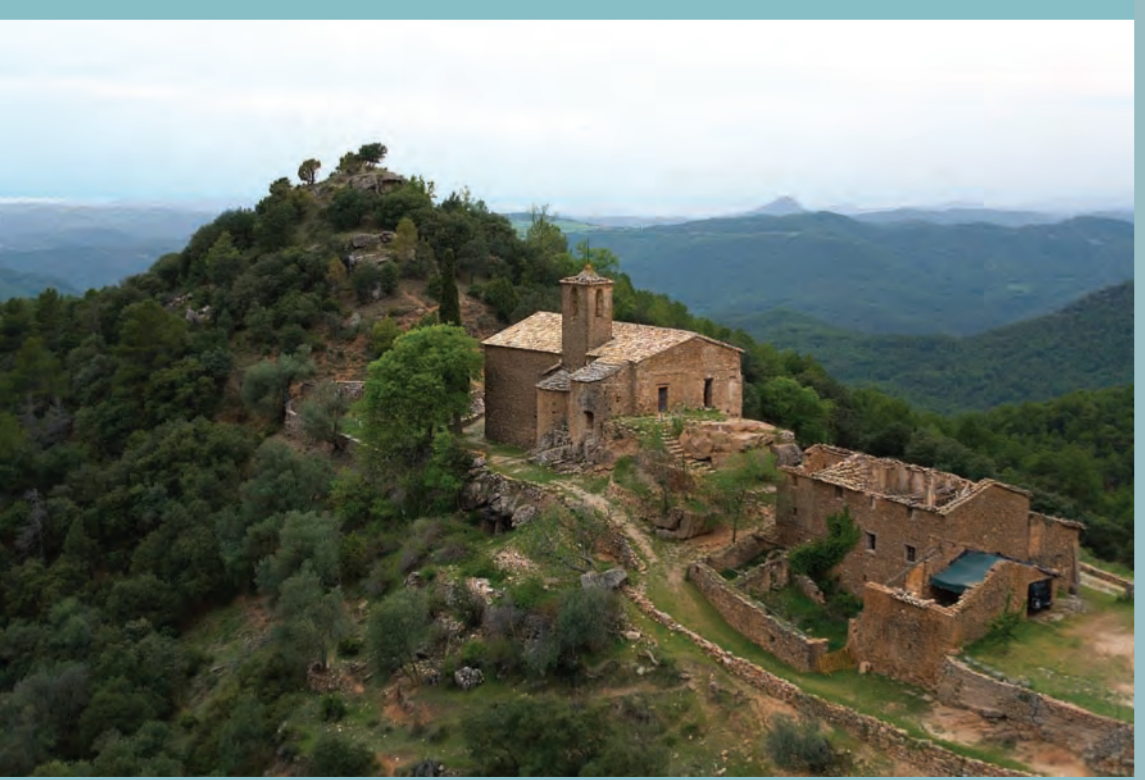
Pas dels Pirineus, Pallerols.

BARCELONA recorregut històric de sant Josepmaria