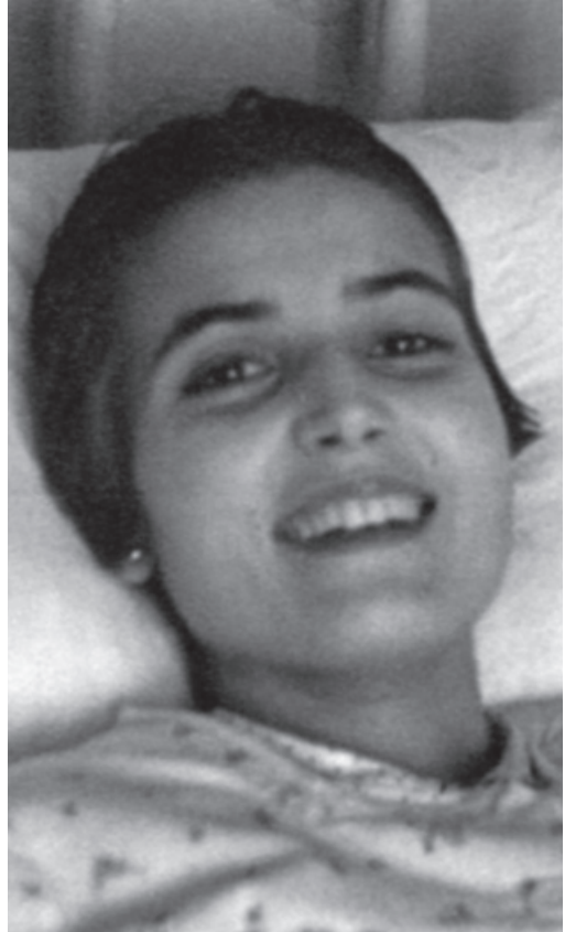
Sempre alegre fins al darrer moment