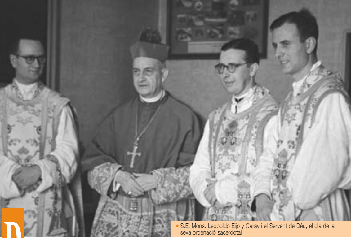
• S.E. Mons. Leopoldo Eijo y Garay i el Servent de Déu, el dia de la seva ordenació sacerdotal