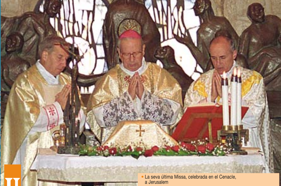
• La seva última Missa, celebrada en el Cenacle, a Jerusalem