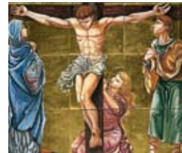
Via Crucis, XII estació: Crist a la Creu. Ceràmica

A la cripta, hi és enterrat monsenyor Álvaro del Portillo (1914-1994), bisbe i primer successor de sant Josepmaria al capdavant de l’Opus Dei.