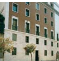
V.le Bruno Buozzi, 75

Informació turística de l'Ajuntament de Roma: 06-488991 Aeroport de Fiumicino: 06-65951 (central) 06-65953640 (arribades i sortides de vols) Estació de Termini: 848-888088 Ràdio taxi: 06-3570; 06-4994; 06-8822