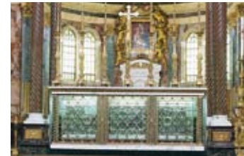
Altar on reposen les sagrades despulles de sant Josepmaria

a la Mare de Déu és la raó del títol de l’església i de la imatge que la presideix. En la cripta de l’església es troben la capella del Santíssim Sagrament i els confessionaris. Sant Josepmaria va predicar amb zel incansable la necessitat de freqüentar els sagraments de la Reconciliació i de l’Eucaristia, dons de Déu als seus fills els homes, font de pau i d’alegria imperibles.