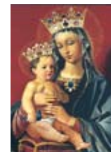
Santa Maria de la Pau. Retaule