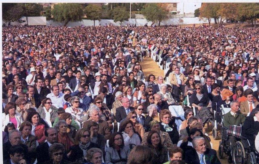
ENCUENTRO GENERAL DE FAMILIAS EN EL COLEGIO AHLZAHIR