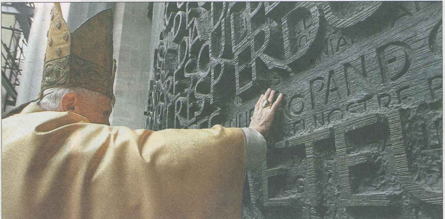
El Papa está llevando a cabo una labor titánica: renovar culturalmente el Viejo Continente.

En este contexto de altura, la polémica sobre la “financiación” del viaje, como es natural, se ha ido difuminando. Recuerdo una anécdota de Juan Pablo II que, bromeando, comentó en una ocasión: “Cuando viajó a Occidente, a veces oigo