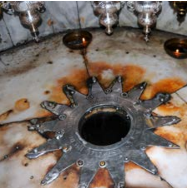
Básilica de la Natividad, Belén