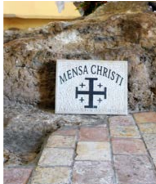
Tabgha, Primado de Pedro