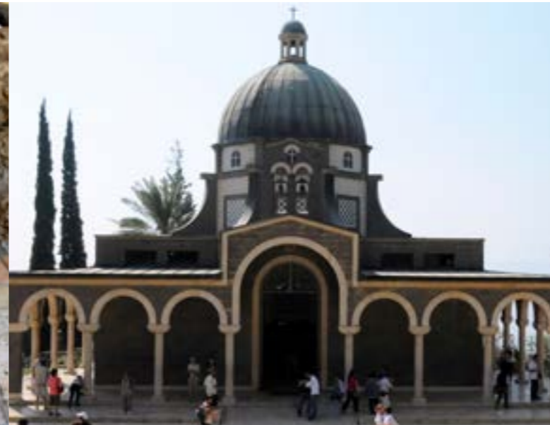
Iglesia de las Bienaventuranzas