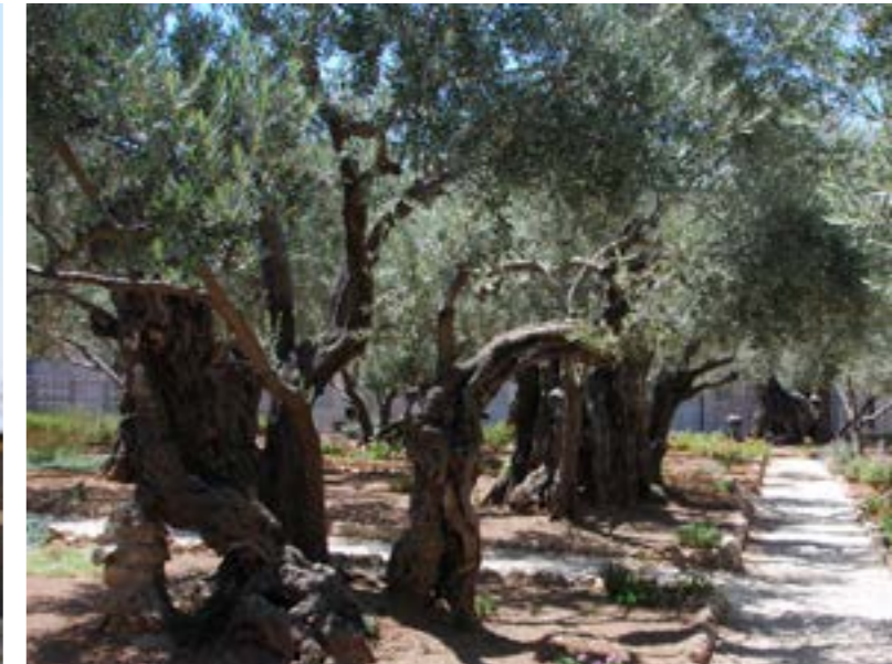
Monte de los Olivos