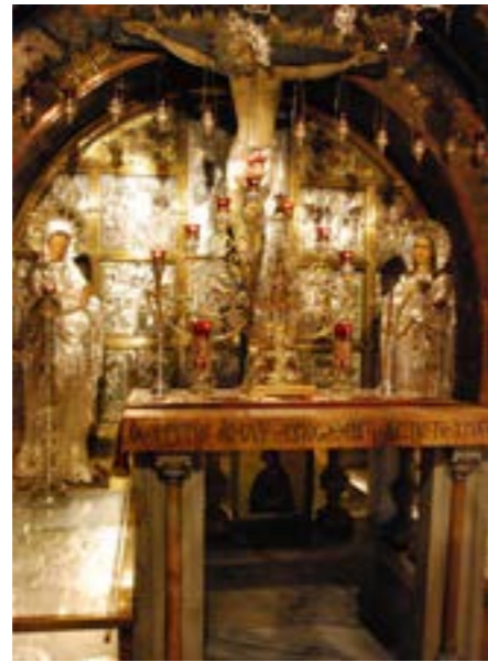
El Calvario, lugar de la crucifixión