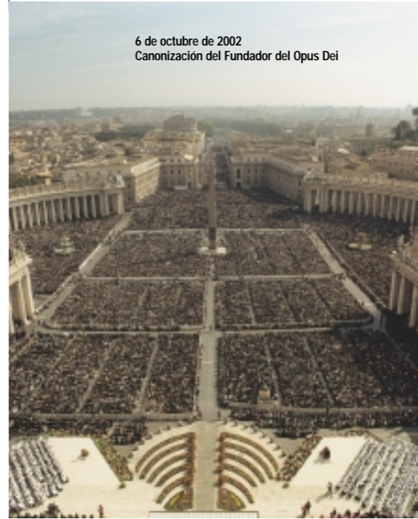
6 de octubre de 2002 Canonización del Fundador del Opus Dei

Su cuerpo reposa en una urna situada bajo el altar de la Iglesia de Santa María de la Paz. Millones de personas en todo el mundo acuden a San Josemaría para solicitar a Dios nuestro Señor gracias de toda clase. Y son muchos quienes se acercan hasta la Iglesia Prelaticia para seguir pidiendo o para agradecer las gracias recibidas por su intercesión.