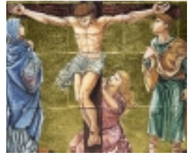
Via Crucis, XII estación: Cristo en la Cruz. Cerámica

mo y los confesonarios. San Josemaría predicó con incansable celo la necesidad de frecuentar los sacramentos de la Reconciliación y la Eucaristía, dones de Dios a sus hijos los hombres, fuente de paz y de alegría imperecedera.