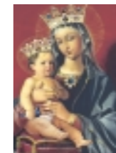
Santa María de la Paz. Retablo

En la cripta está enterrado Mons. Álvaro del Portillo (1914-1994), Obispo y primer sucesor de San Josemaría al frente del Opus Dei.