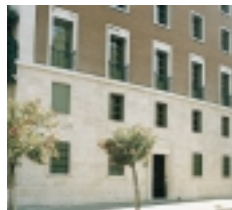
V.le Bruno Buozzi, 75

Viale Bruno Buozzi, 75 00197 Roma Teléfono: 06-808961