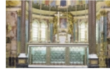
Altar donde reposan los sagrados restos de San Josemaría

El 31 de diciembre de 1959, San Josemaría celebró la primera Misa en Santa María de la Paz, que desde la erección del Opus Dei como Prelatura personal pasó a ser la Iglesia Prelaticia. La devoción de Mons. Escrivá a la Virgen es la razón del título de la iglesia y de la imagen que la preside. En la cripta de la Iglesia se encuentran la Capilla del Santísimo