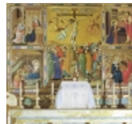
Capilla del Santísimo Sacramento