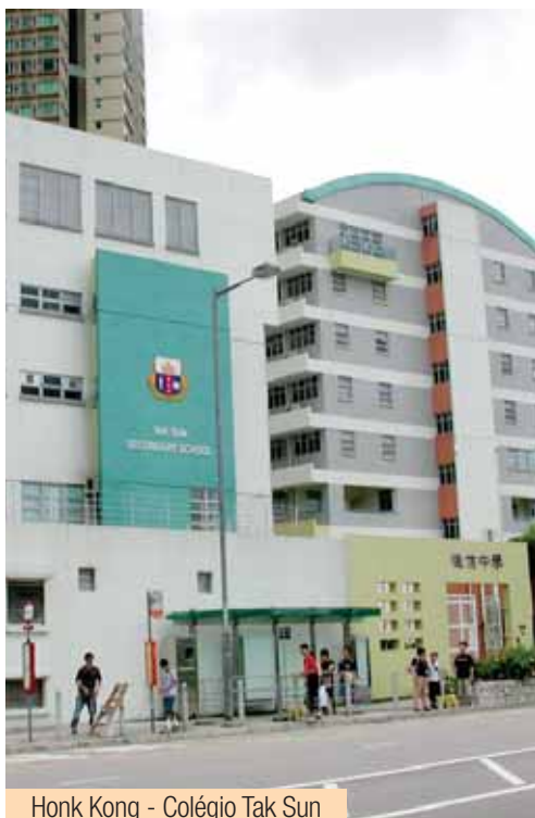
Honk Kong - Colégio Tak Sun

peças, entre as quais algumas do Opus Dei, aceitou o desafio de assumir a direcção da antiga escola primária Tak Sun School, então com 70 anos de