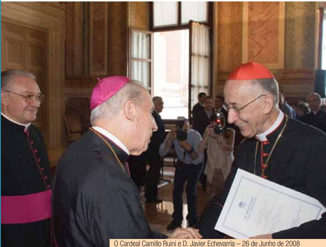
O Cardeal Camillo Ruini e D. Javier Echevarría – 26 de Junho de 2008

No dia 26 de Junho de 2008, festa de S. Josemaria Escrivá, terminou o processo introdutório levado a cabo pelo Tribunal da Diocese de Roma sobre a vida e as virtudes de D. Álvaro. O acto, que teve lugar no Palácio de Latrão, foi presidido pelo Cardeal Camillo Ruini, numa das suas últimas intervenções oficiais como Vigário da Diocese do Papa. Na cerimónia estiveram presentes o