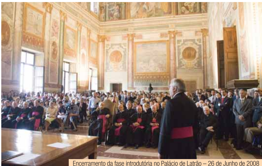
Encerramento da fase introdutória no Palácio de Latrão – 26 de Junho de 2008