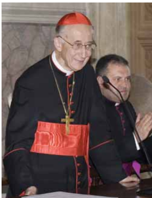
• O Cardeal Camillo Ruini encerra a instrução do processo do Tribunal do Vicariato de Roma – 26 de Junho de 2008

Uma vez terminada a fase de instrução, começa a redacção da positio super vita et virtutibus , isto é, um resumo sistemático das provas que surgem da investigação processual que se efectuou, para averiguar o modo como o Servo de Deus viveu as virtudes cristãs em grau heróico. Depois de concluída, a positio será apresentada à Congregação para as Causas dos Santos pelo Postulador da causa, Mons. Flavio Capucci. E finalmente, depois de a estudar, a Congregação pronunciar-se-á sobre a heroicidade das virtudes do servo de Deus.