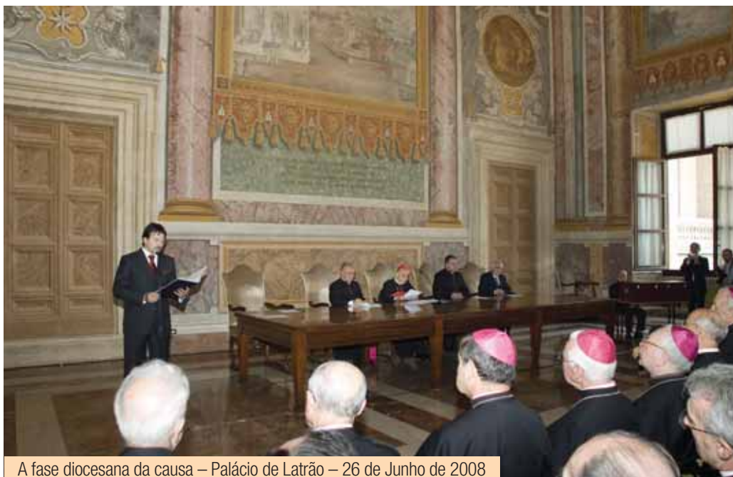
A fase diocesana da causa – Palácio de Latrão – 26 de Junho de 2008

to outros, se fizeram com a colaboração dos correspondentes tribunais das Dioceses nas quais se encontravam as testemunhas. Entre outros, colaboraram os tribunais de Madrid, Pamplona, Leiria-Fátima, Montreal, Quito, Sydney, Varsóvia e Washington.