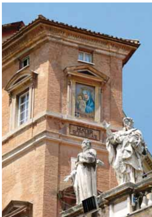
O mosaico de Santa Maria Mater Ecclesiae que dá para a Praça de S. Pedro.

donna della colonna que procede da basílica de Constantino) foi colocado no dia 7 de dezembro de 1981 e, no dia seguinte, depois de rezar o Angelus , João Paulo II abençoou-o, manifestando o desejo de «que todos os que vierem a esta praça de S. Pedro, elevem o olhar para Ela para Lhe dirigir, com sentimento de filial confiança, a sua própria saudação e a sua própria oração» (8 de dezembro de 1981).