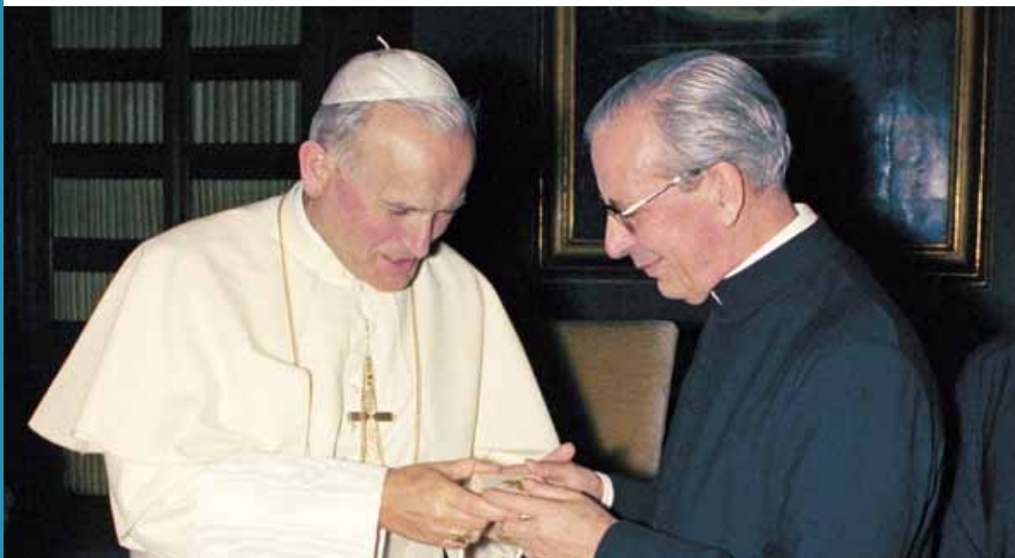
Primeira audiência com o Papa João Paulo II (1978).