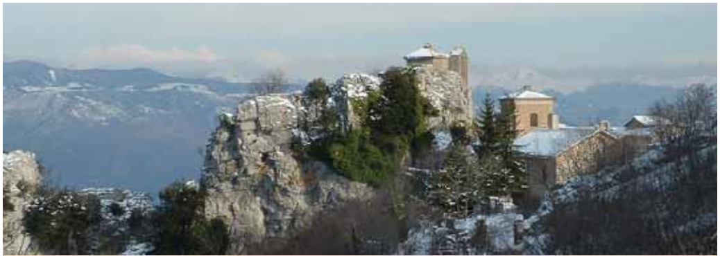
Santuário de La Mentorella.

ter erigido esta parte da Igreja em Prelatura pessoal, a beatificação e canonização de S. Josemaria ou a criação da Universidade Pontifícia da Santa Cruz.