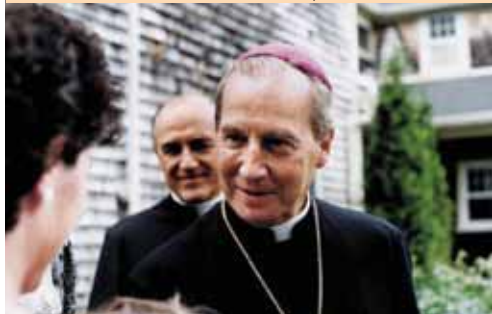
D. Javier Echevarría, atual Prelado do Opus Dei.