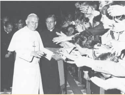
O Papa e os universitários em 1979.

gavam a Semana Santa passada na cidade de Pedro, com visitas e intercâmbios culturais.