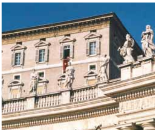
João Paulo II benzeu a imagem a partir desta janela.

del Portillo a concelebrar a Missa na sua capela privada e depois a tomar o pequeno-almoço; desejava comunicar-lhe a alegria de ter benzeu a imagem da praça e queria agradecer-lhe a sugestão para a colocar ali.