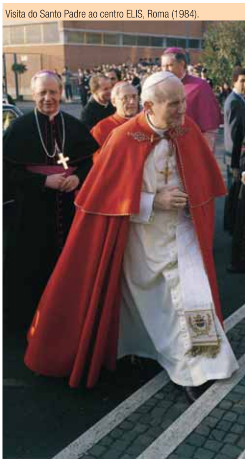
Visita do Santo Padre ao centro ELIS, Roma (1984).

- Algumas recordações relacionadas com o atentado de 1981?