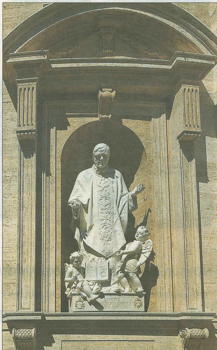
Estatua de Escrivá de Balaguer en la basílica de San Pedro, en Roma.

"Sin miedo ni vergüenza, con el objetivo no de adaptarse al mundo, sino de convertirlo y renovarlo". Éste es el reto que hace al Opus el cardenal arzobispo de Madrid y presidente de la Conferencia Episcopal Española, Antonio María Rouco Varela.