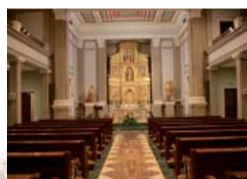
ORATORIO. La Clínica cuenta con dos oratorios y apoyo espiritual.