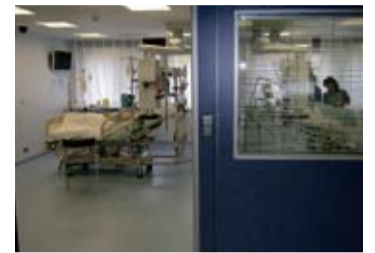
Además de la UCI convencional, cuenta con una UCI pediátrica con luz natural.