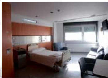
HABITACIÓN. La gran mayoría de las habitaciones son individuales.

300 camas 8 plantas 285 médicos 170 residentes 800 enfermeras y auxiliares 47 especialidades 78.954 consultas médicas al año 63.724 consultas quirúrgicas al año 12.329 ingresos hospitalarios al año