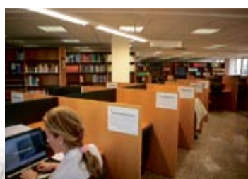
BIBLIOTECA. Posee 5.000 títulos de acceso directo y más de 15.600 colocados en depósito.