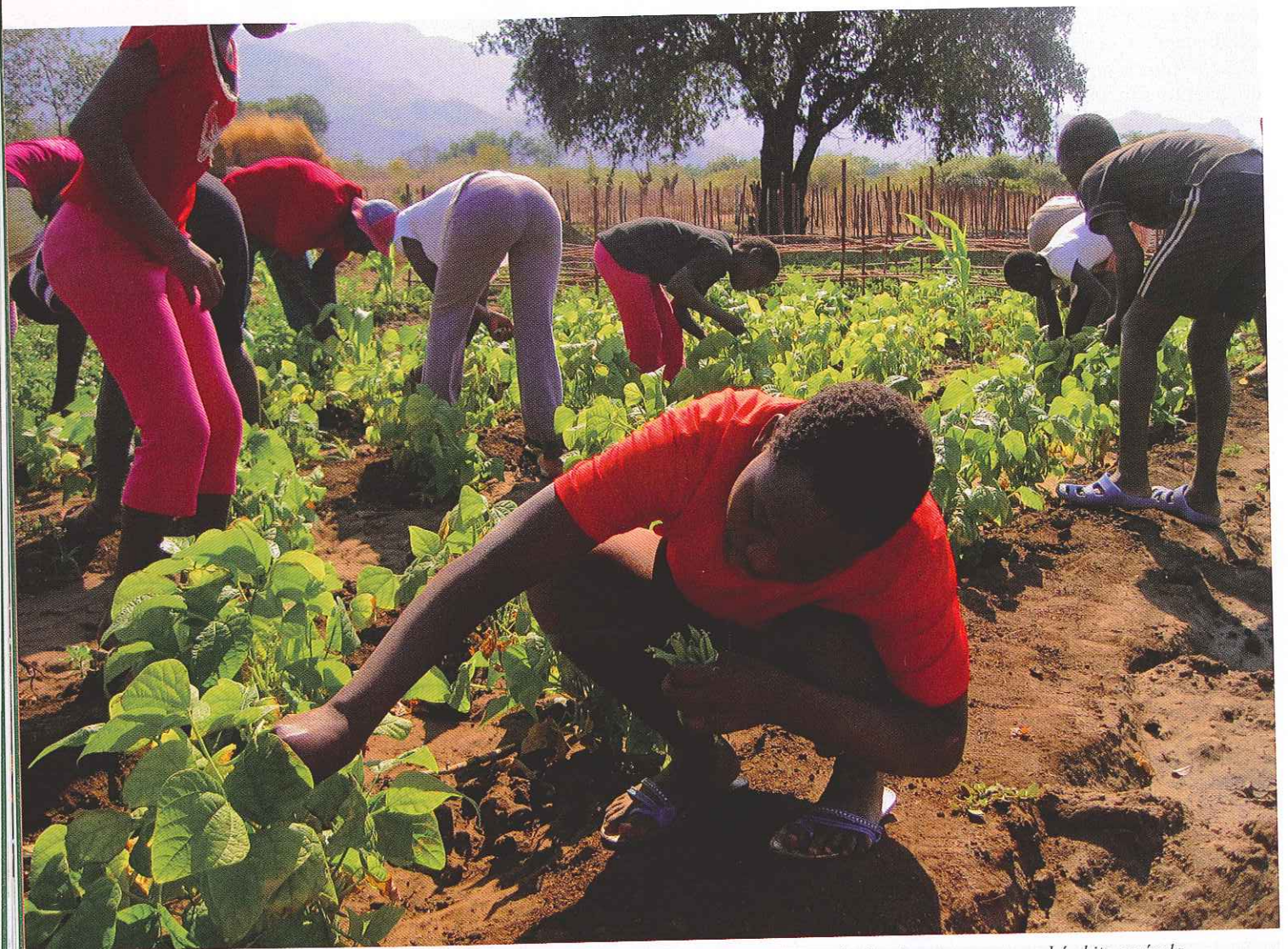
Proyecto en Mozambique que prevé la formación profesional de mujeres jóvenes y la creación de micro empresas en el ámbito agrícola

—¿Cómo están afrontando los cristianos la creciente acción terrorista de los grupos yihadistas en el norte y centro de África?