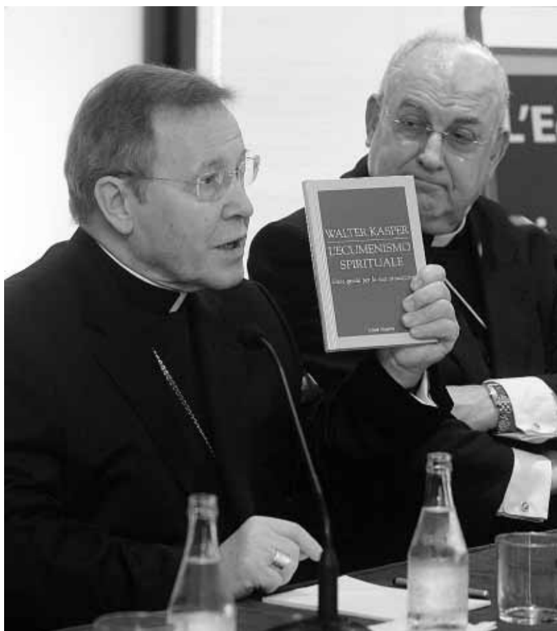
El cardenal Kasper presenta en Barcelona su libro sobre el ecumenismo

Al ser preguntado por La Vanguardia sobre estas informaciones difundidas en Gran Bretaña, Walter Kasper reaccionó con cara de sorpresa y escepticismo. "Non é vero" fueron sus primeras palabras.