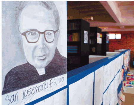
La clase de dibujo técnico retrató a San Josemaría Escrivá.