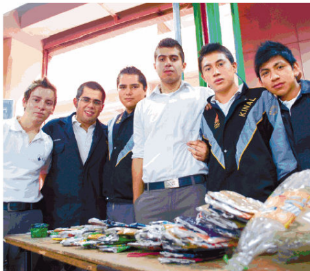
El proyecto de estos estudiantes fue un "compactalatas".