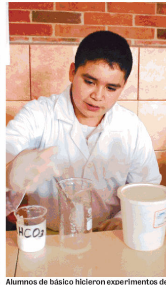
Alumnos de básico hicieron experimentos de química y física.