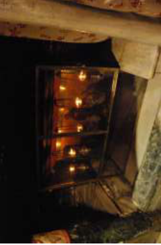
Lieu de la mangeoire.