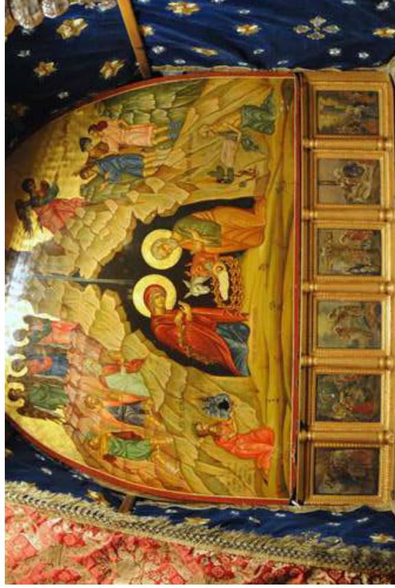
Retable au-dessus de l'endroit où Jésus est né.

Or, pendant qu'ils étaient là, le temps où elle devait enfanter s'accomplit, et elle mit au monde son fils premier-né, l'emballota et le coucha dans une crèche, parce qu'il n'y avait pas de place pour eux dans l'hôtellerie (Lc 2, 6-7).