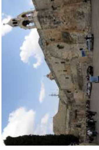
Place devant la basilique de la Nativité