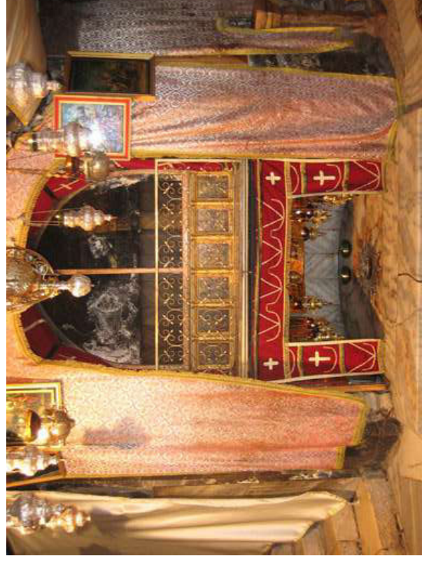
Grotte de la Nativité.