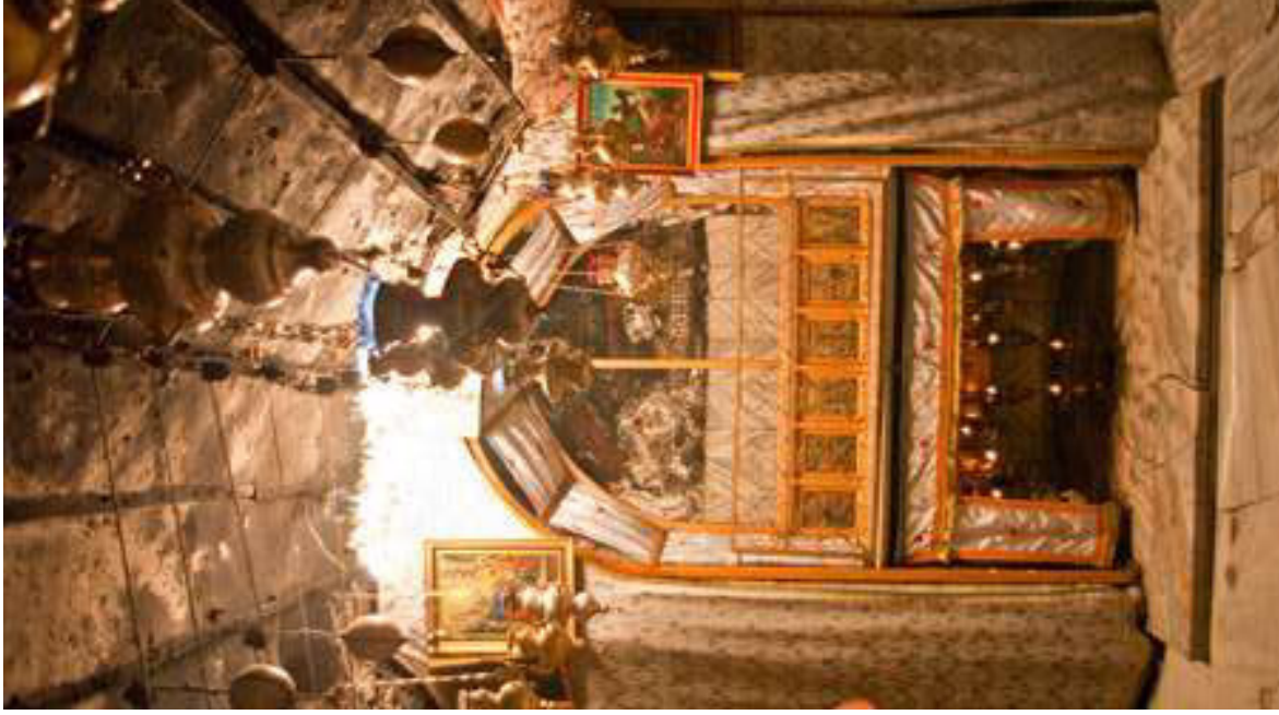
Lieu où Jésus est né.