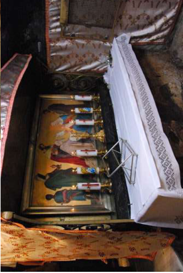
Autel des Rois Mages, en face de la mangeoire.