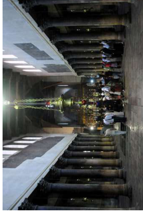
Nef centrale de la basilique.

Saint Cyrille de Jérusalem découvrit le terrain où se trouvait la grotte enfoui sous les arbres(Saint Cyrille de Jérusalem, Catéchèse , 12, 20: «Il y encore peu d'années, c'était un lieu très boisé»), et saint Jérôme parle aussi, non sans ironie, de la tentative de paganiser la mémoire chrétienne: «Bethléem est désormais pour nous le lieu le plus auguste de la terre, celui dont parle le psalmiste pour dire: La vérité germera de la terre (Ps 84, 12), fut sous l'ombre du bois de Thamuz, c'est-à-dire d'Adonis, et dans la grotte où jadis le Christ émit ses premiers vagissements, on pleurait l'amant de Vénus » (Saint Jérôme, Ibid.).