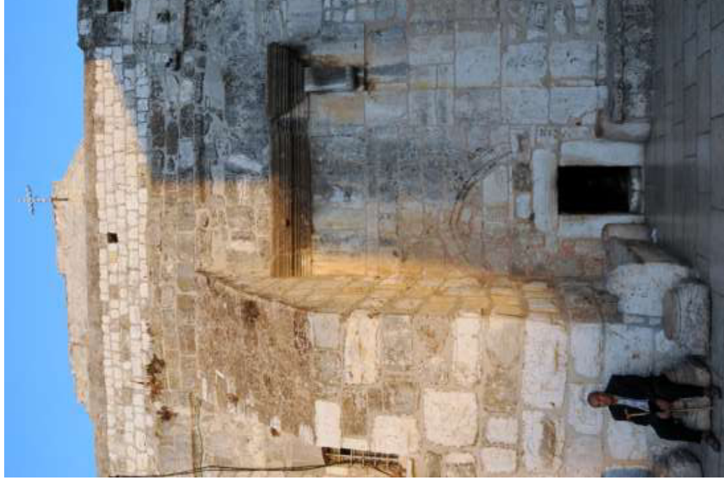
La porte a un mètre et demi à peine.

On pense que Bethléem fut fondée par les Cananéens vers l'an 3000 avant Jésus-Christ. Les Philistins l'ont conquise par la suite. Dans la Sainte Écriture on fait pour la première fois allusion à Bethléem, appelée aussi Ephrata ou « la fertile », dans le livre de la Genèse lorsqu'on parle de la mort et de la sépulture de Rachel, la deuxième épouse du patriarche Jacob : Rachel mourut et fut ensevelie sur la route d'Ephrata, c'est-à-dire de Bethléem (Gn 35, 19).