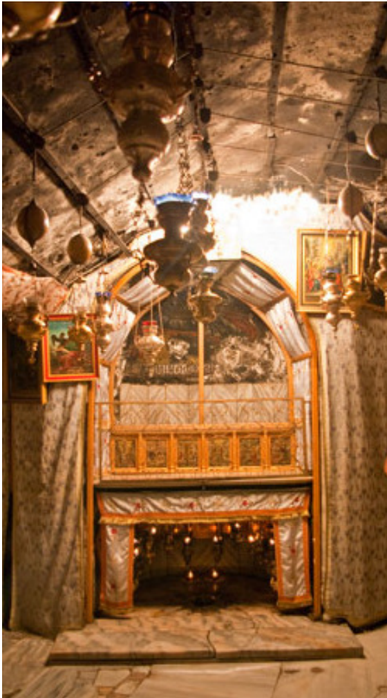
Luogo della nascita di Gesù.