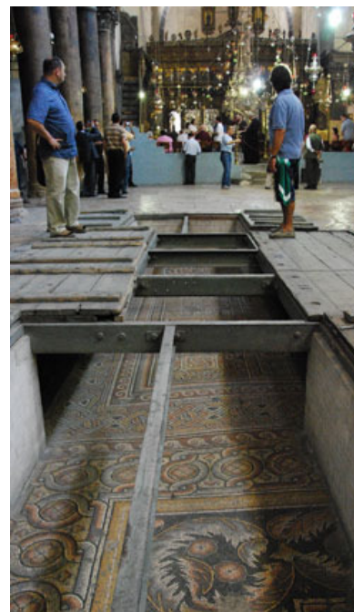
Resti di mosaici bizantini pavimentali.