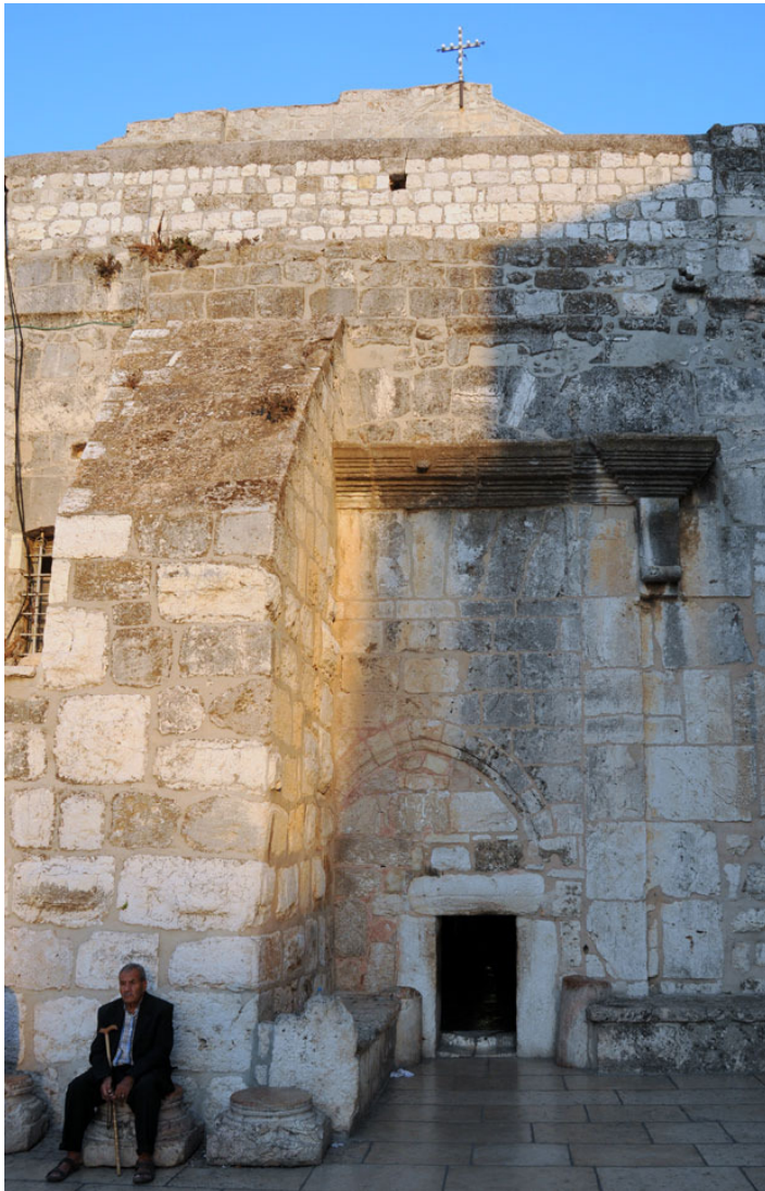
La porta della Basilica della Natività è alta un metro e mezzo.