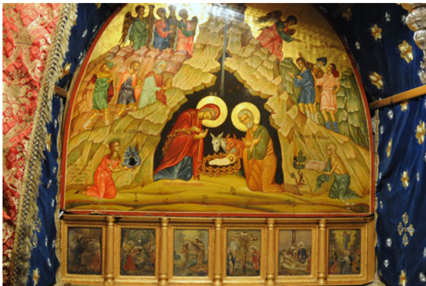
Pala d'altare raffigurante la nascita di Gesù

Ora, mentre si trovavano in quel luogo, si compirono per lei i giorni del parto. Diede alla luce il suo figlio primogenito, lo avvolse in fasce e lo depose in una mangiatoia, perché non c'era posto per loro nell'albergo 11 .