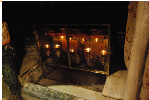
Luogo della mangiatoia.