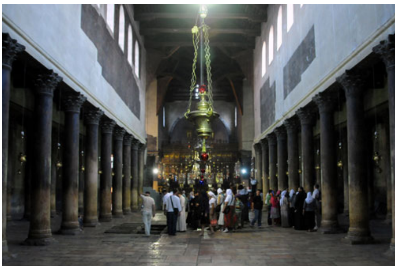
Navata centrale della basilica.

Qualcosa di simile accadde a Betlemme, poiché il luogo della nascita di Gesù fu trasformato in un bosco sacro in onore di Adone. San Cirillo di Alessandria vide i luoghi dov'era la grotta coperti da alberi 17 , e anche san Girolamo fa riferimento al tentativo fallito di paganizzare questo luogo cristiano con parole non prive di ironia: "La nostra Betlemme, il luogo più venerato del mondo, che fece dire al salmista: Verità germoglierà dalla terra (Sal 84,12), era coperta dall'ombra di un bosco dedicato a Thamuz, cioè Adone, e nella grotta dove si udirono i primi vagiti di Cristo, si pregava l'amante di Venere" 18 .