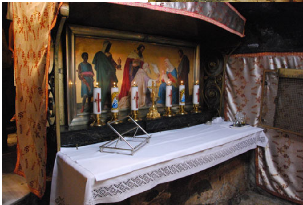
Altare dei Re Magi di fronte alla mangiatoia.