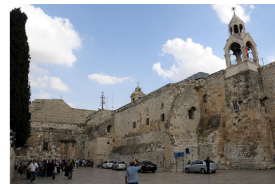
Davanti alla basilica della Natività si apre un'ampia piazza.