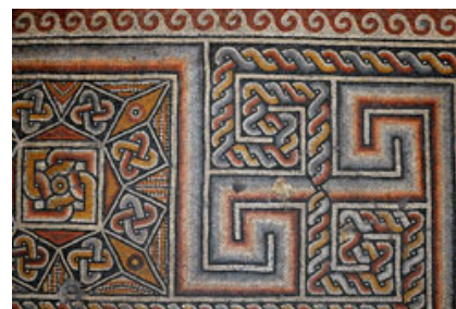
Dettaglio di un mosaico del pavimento.