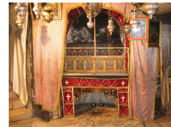
Luogo della nascita di Gesù Foto: Darko Tepert (Wikimedia Commons).

La basilica – a croce latina con cinque navate – è lunga 54 metri. Le quattro file di colonne, di color rosato, conferiscono all'interno un aspetto armonioso. In alcuni punti si possono ammirare i mosaici che ricoprivano il pavimento della prima chiesa costantiniana; anche alle pareti si sono conservati frammenti di altri mosaici dei tempi delle crociate.