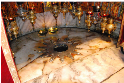
Il punto della nascita è indicato con una stella d'argento.