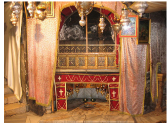
Luogo della nascita di Gesù

La basilica – a croce latina con cinque navate – è lunga 54 metri. Le quattro file di colonne, di color rosato, conferiscono all'interno un aspetto armonioso. In alcuni punti si possono ammirare i mosaici che ricoprivano il pavimento della prima chiesa costantiniana; anche alle pareti si sono conservati frammenti di altri mosaici dei tempi delle crociate.