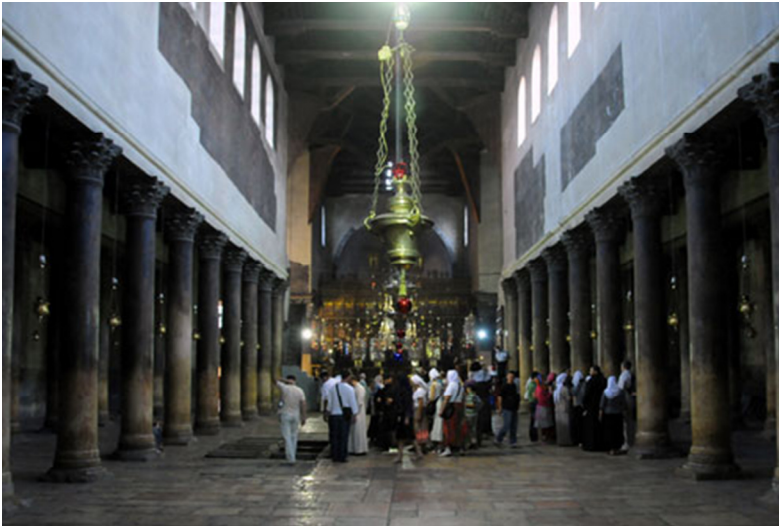
Navata centrale della basilica.

Qualcosa di simile accadde a Betlemme, poiché il luogo della nascita di Gesù fu trasformato in un bosco sacro in onore di Adone. San Cirillo di Alessandria vide i luoghi dov'era la grotta coperti da alberi 17 , e anche san Girolamo fa riferimento al tentativo fallito di paganizzare questo luogo cristiano con parole non prive di ironia: "La nostra Betlemme, il luogo più venerato del mondo, che fece dire al salmista: Verità germoglierà dalla terra (Sal 84,12), era coperta dall'ombra di un bosco dedicato a Thamuz, cioè Adone, e nella grotta dove si udirono i primi vagiti di Cristo, si pregava l'amante di Venere" 18 .