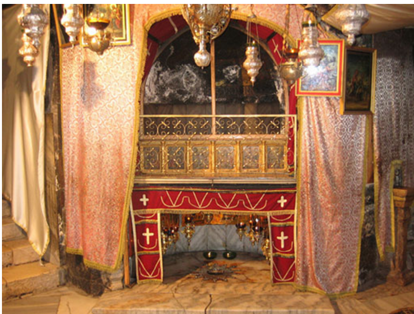
Grotta della Natività.

Gesù nacque in una grotta di Betlemme, dice la Scrittura, “perché non c'era per essi posto nell'albergo” 2 . Betlemme, fondata dai cananei verso l'anno 3000 a. C., è menzionata in alcune lettere spedite dal governatore egiziano della Palestina al suo Faraone, intorno all'anno 1350 a. C., dopo la conquista dei Filistei. Nella Sacra Scrittura si fa riferimento a Betlemme – che allora era chiamata Efrata: la fertile – nel libro della Genesi, quando si parla della morte e sepoltura di Rachele, la seconda moglie del patriarca Giacobbe: Rachele morì, e fu sepolta sulla via di Efrata; cioè di Betlemme 3 .