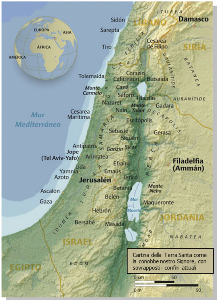
Cartina della Terra Santa come la conobbe nostro Signore, con sovrapposti i confini attuali