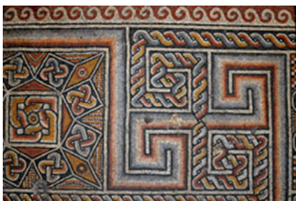
Dettaglio di un mosaico del pavimento.