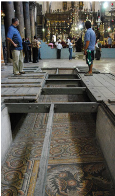
Resti di mosaici bizantini pavimentali.