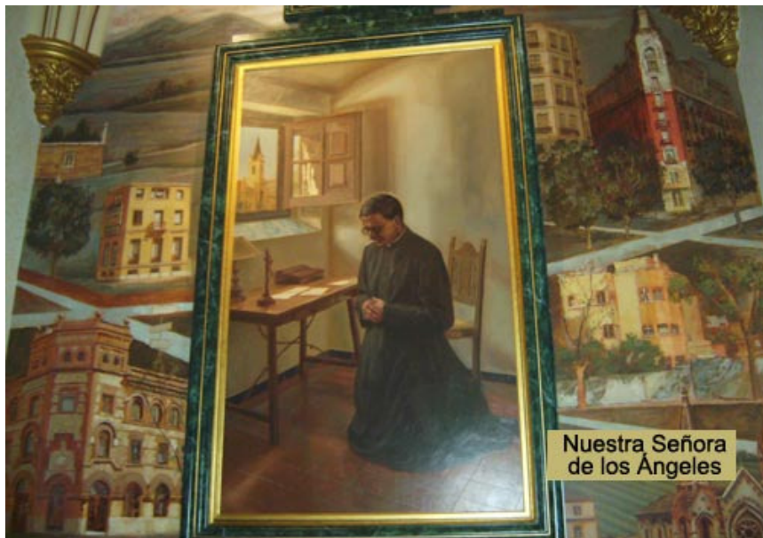
Una cappella della Parrocchia di Nostra Signora degli Angeli ricorda la fondazione dell'Opus Dei

Esattamente tre anni dopo avrebbe descritto così la sostanza di quanto accaduto: