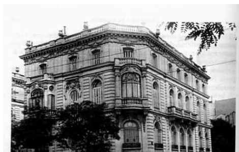
L'edificio in calle Diego de León nel 1940 e al giorno d'oggi