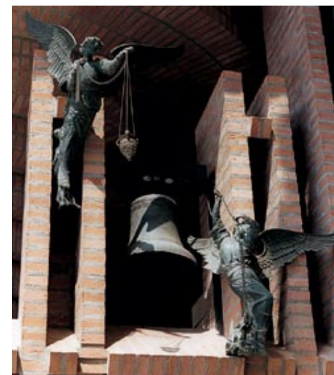
«Ricordo con emozione il suono delle campane della parrocchia di Nostra Signora degli Angeli» diceva San Josemaría Escrivá. Una di quelle campane si trova attualmente nel Santuario di Torreciudad.

Nei piccoli eventi quotidiani, vissuti con amore e alla perfezione, nelle fatiche e nelle difficoltà, nelle gioie, in un lavoro professionale eseguito bene, nel servizio alla società e al prossimo, è sempre racchiuso un tesoro. Perché il lavoro professionale e le relazioni sociali costituiscono l'ambito e